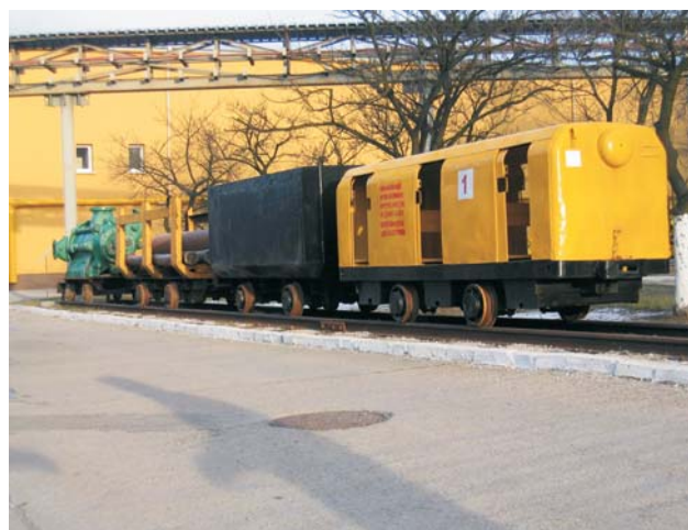
Ryc. 3. Tabor szynowy