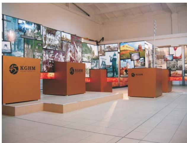
Ryc. 2. Ekspozycja fotograficzna