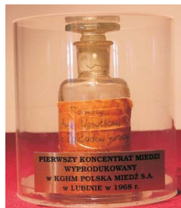
Ryc. 1. Próbkę pierwszego koncentratu miedzi z 1968 r.