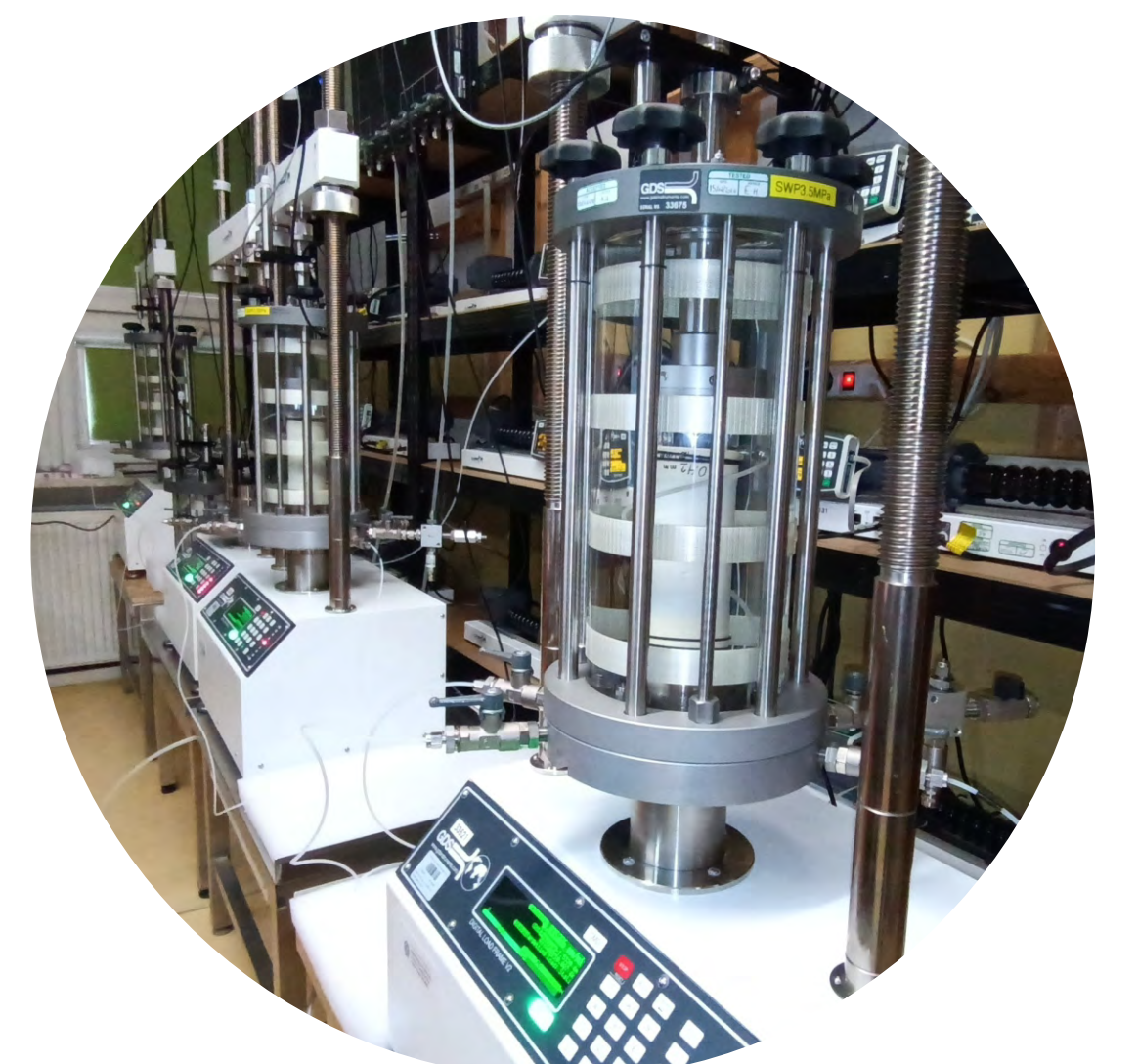
Aparatura badawcza wykorzystywana w laboratorium CBGS do oznaczania parametrów wytrzymałościowych na potrzeby charakterystyki serii litologiczno-genetycznych