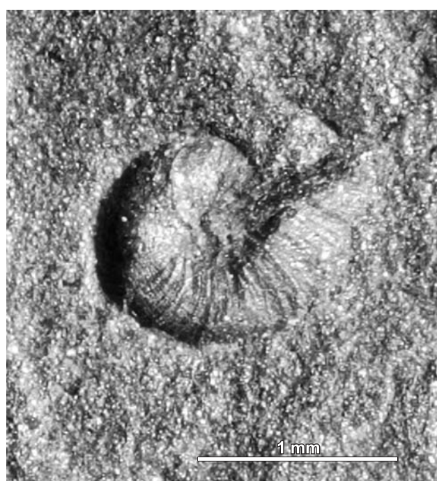
Ryc. 2. ? Microconchus sp. z okazu nr 2011.08.06/SK/0.00