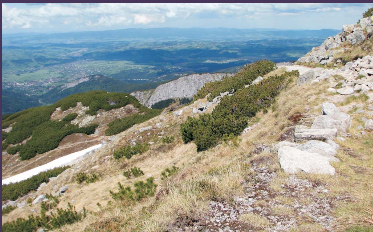
Ryc. 4. Panoramiczny widok z grzbietu Suchego Upłazu ku północy na odsłonięcia granitów porfirowatych typu Goryczkowej na Suchej Czuby (1695,4 m n.p.m.). Na dalszym planie Czuba Jaworzyńska i Nosal, a w oddali – Podhale. Obie fot. Z. Cymerman