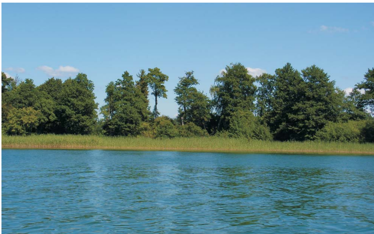
Ryc. 1. Jezioro Serwy – polodowcowe, wytopiskowo-rynnowe, mezotroficzne, o powierzchni ok. 460 ha i głębokości do 41,5 m. Szmaragdowy kolor wody jest cechą charakterystyczną tego zbiornika. Wody wymienionego jeziora zasilają wody Kanału Augustowskiego, utrzymując w nim stały poziom. Pojezierze Suwalskie