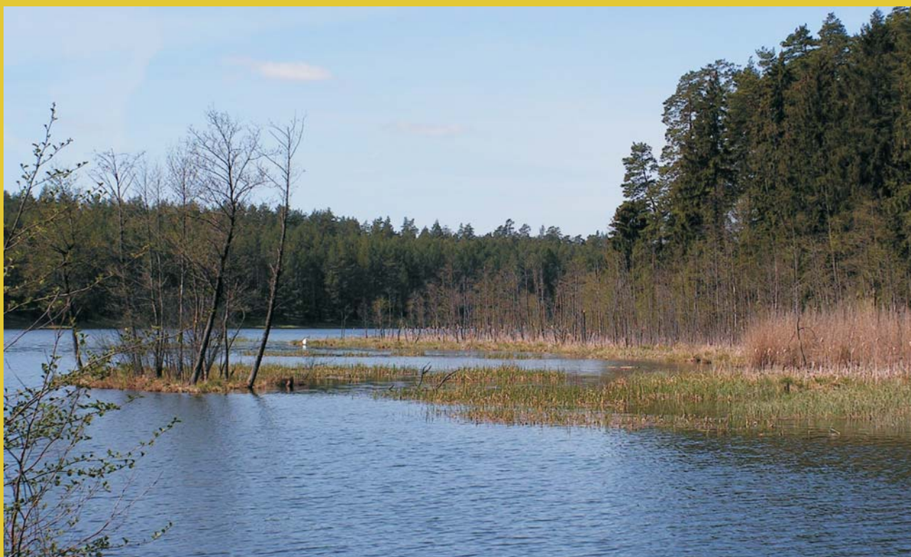
Ryc. 4. Jezioro Krzywe – eutroficzne, partiami zabagnione, o powierzchni ok. 22 ha i głębokości do 6 m. Położone jest na szlaku Kanału Augustowskiego. Od końca XIX w. zbiornik sztucznie ograniczono od wschodu śluzą Perkuć, a od zachodu dwukomorową śluzą Paniewo, co związane było z budową kanału. Pojezierze Suwalskie.