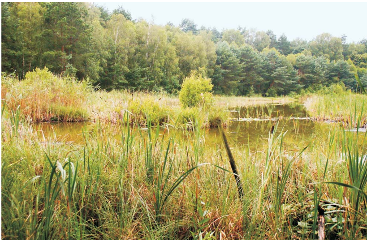
Ryc. 2. Jezioro Święte – torfowisko, rezerwat o powierzchni ok. 7 ha utworzony w celu ochrony torfowiska przejściowego, posiadający cenne siedliska ekosystemu jeziora humusowego (dystroficznego). Zbiornik bezodpływowy. Pojezierze Leszczyńskie.