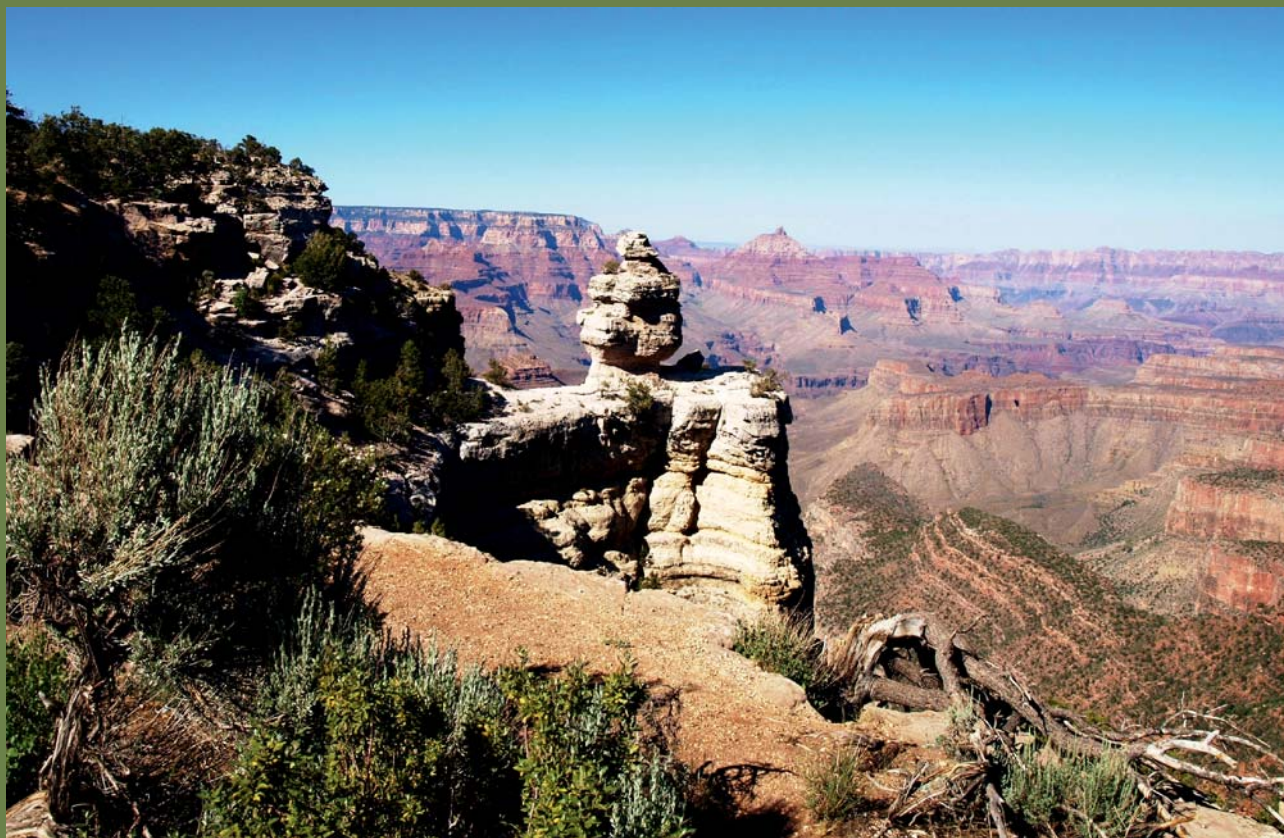
Ryc. 2. Widok na Grand Canyon rzeki Colorado, wcinającej się do głębokości ok. 1800 m, poprzez pakiet skał od prekambriu do neogenu. Widoczne charakterystyczne formy skalne jako rezultat długotrwałego wietrzenia.