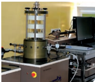
ZESTAW DO BADAŃ DYNAMICZNYCH TRÓJOSIOWYCH TXT

OFERTA WSPÓŁPRACY W ZAKRESIE GEOLOGII INŻYNIERSKIEJ GEOLOGII ŚRODOWISKOWEJ ORAZ GEOFIZYKI