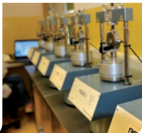
ZESTAW AUTOMATYCZNYCH EDOMETRÓW