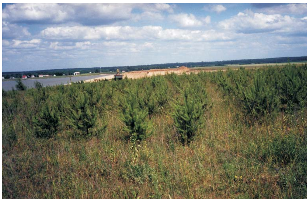
Ryc. 3. Rekultywowane w kierunku leśnym zwałowisko wewnętrzne piasków odpadowych kopalni Sobolewo; w głębi eksploatacja złoża i fragment wyrobiska po eksploatacji spod wody Fig. 3. Reforested internal dump of waste sands of the Sobolewo Mine; farther in the background: exploitation of the deposit and a part of the excavation pit after exploitation from under water

składowaną w tymczasowych zwałach zewnętrznych, zlokalizowanych przy krawędziach wyrobiska. Zwałowanie wewnętrzne nie powoduje zajmowania dodatkowych terenów, a ponadto minimalizuje wpływ robót górniczych zarówno na powierzchnię, jak i na reżim wód podziemnych w rejonie złoża. Realizowany leśno-wodny kierunek rekultywacji wyrobisk poeksploatacyjnych pozwala na dobre wkomponowanie terenu przekształconego w krajobraz (ryc. 3).