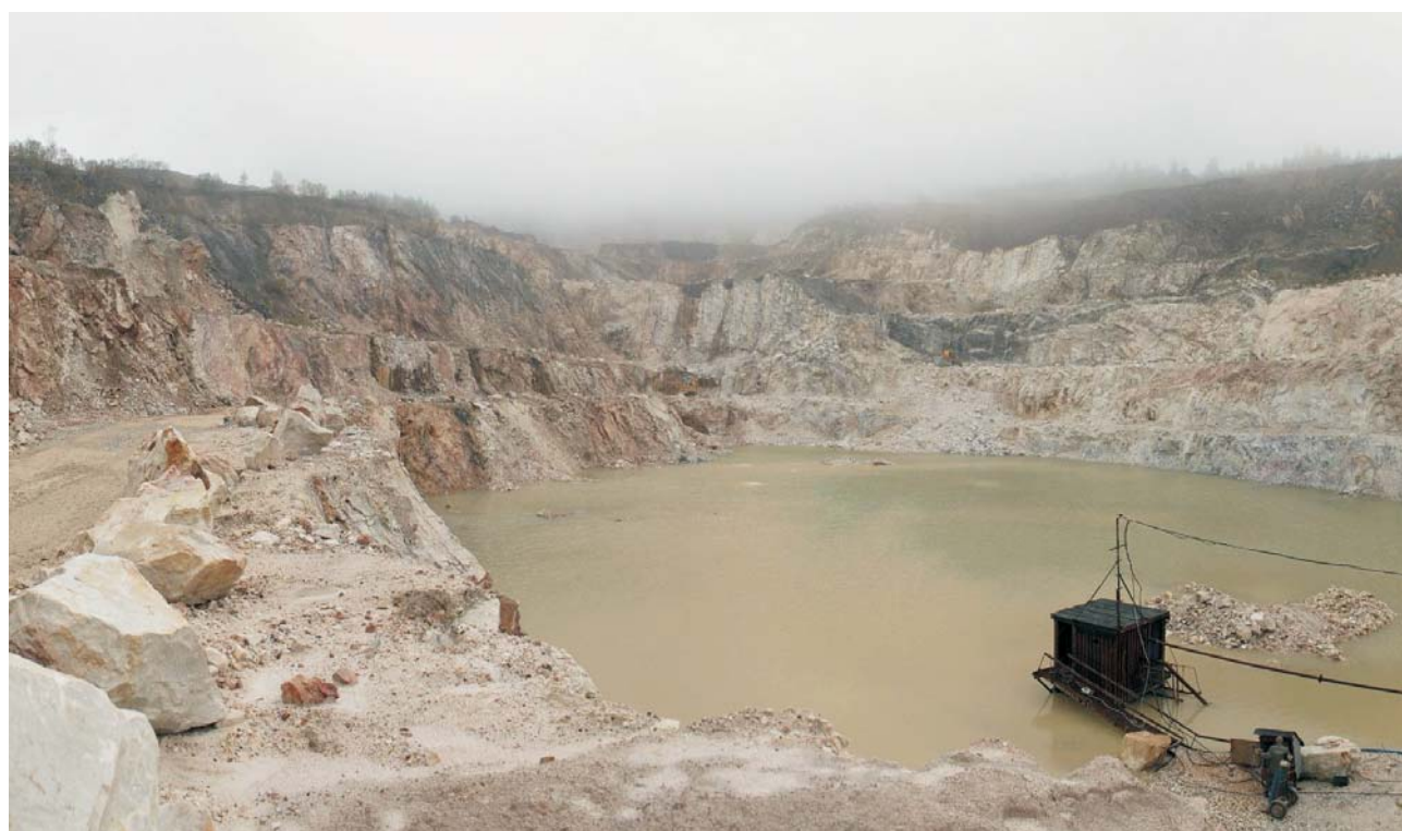
Ryc. 13. Rudawy Janowickie – Kamieniołom dolomitu Rędziny – widok ogólny w mglisty dzień. Ryc. 12–13 fot. J. Pacuła Fig. 13. Rudawy Janowickie Mts. – Rędziny dolomite quarry – general view in the foggy day. Figs. 12–13 photo by J. Pacuła