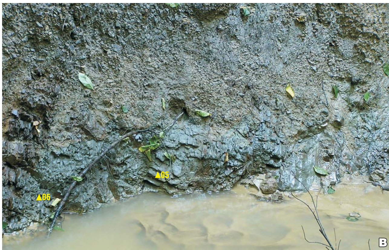
Ryc. 2. Odslonięcia warstw chodenickich w Chodenicach: A – górna część doliny potoku Grabowiec; B – parów Lipie. Trójkątami zaznaczono miejsca pobrania próbek na mikroskamieniałości.