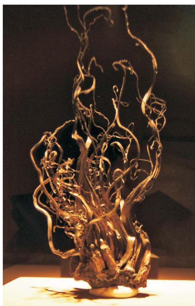
Ryc. 5. Srebro rodzime; Brand k. Freibergu.