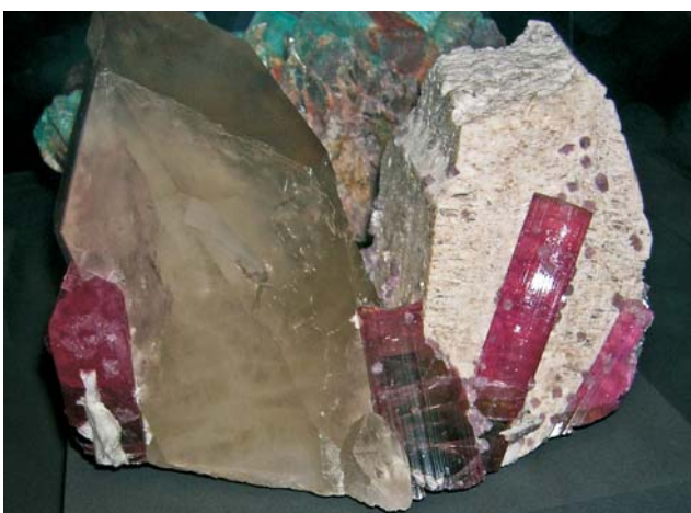
Ryc. 4. Elbait (czerwonawa odmiana turmalinu), kwarc (szary), skałecń potasowy (jasny); Himalaya Mine, San Diego Kalifornia, USA