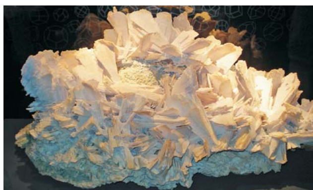
Ryc. 3. Pseudomorfoza kwarcu po anhydrycie; Rio Grande do Sul, Brazylia