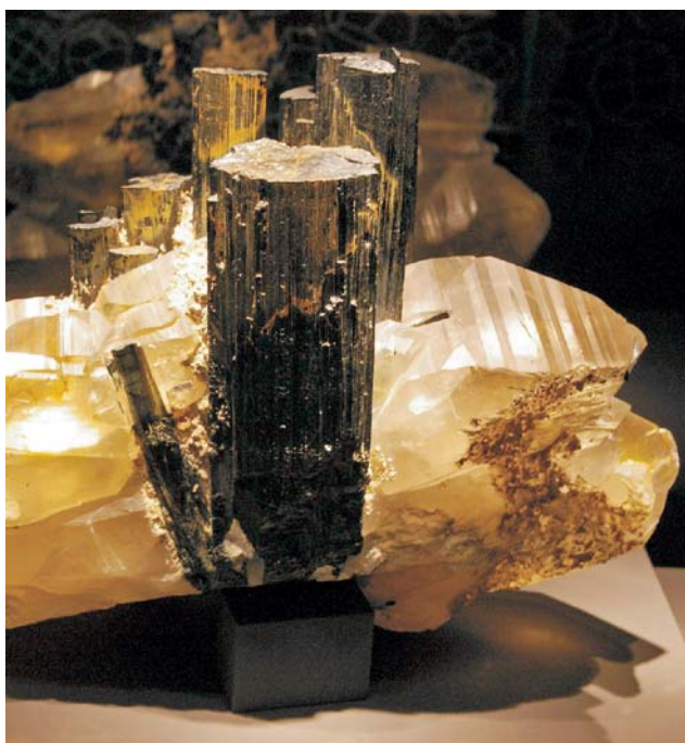
Ryc. 1. Czarny turmalin – schörl z kwarcem; Minas Gerais, Brazylia