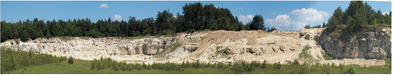
Ryc. 5. Kamieniołom wapieni miocenu w Żelebsku.