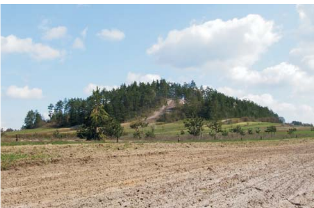
Ryc. 7. Ostaniec denudacyjny Kamienna Góra koło Tereszpoli.