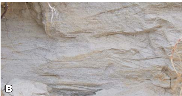
Ryc. 6. Odślonięcie przekątnie warstwowanych piasków miocenu w Lipowcu: A – żółte piaski w stropie kompleksu; B – białe piaski kwarcowe podścielające kompleks „A”.