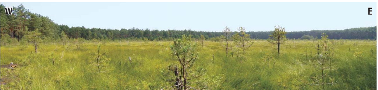
Ryc. 10. Torfowisko wysokie w Hamerni.