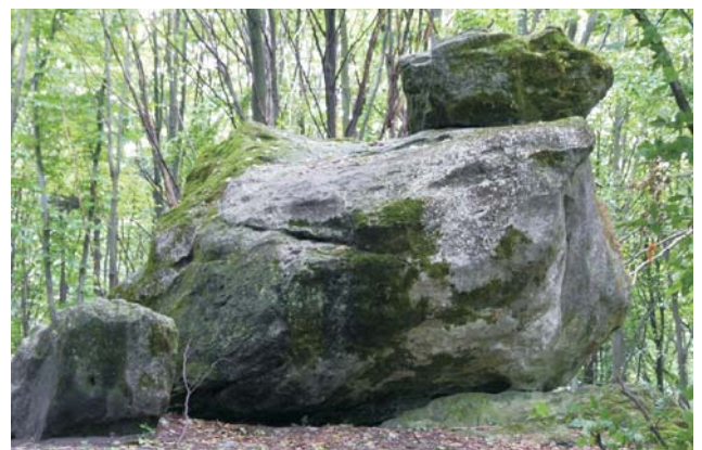
Ryc. 9. Formy skałkowe – pomnik przyrody nieożywionej „Piekielko” koło Stanisławowa.