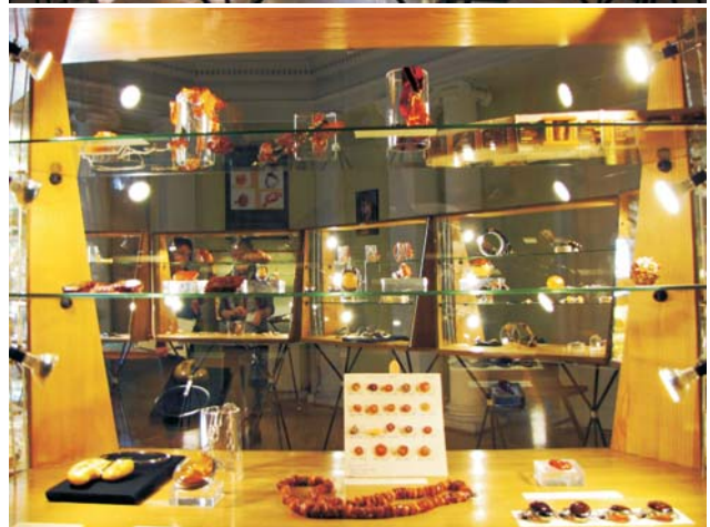
Ryc. 4. Wystawa „Bursztyn nie tylko nad Bałtykiem”