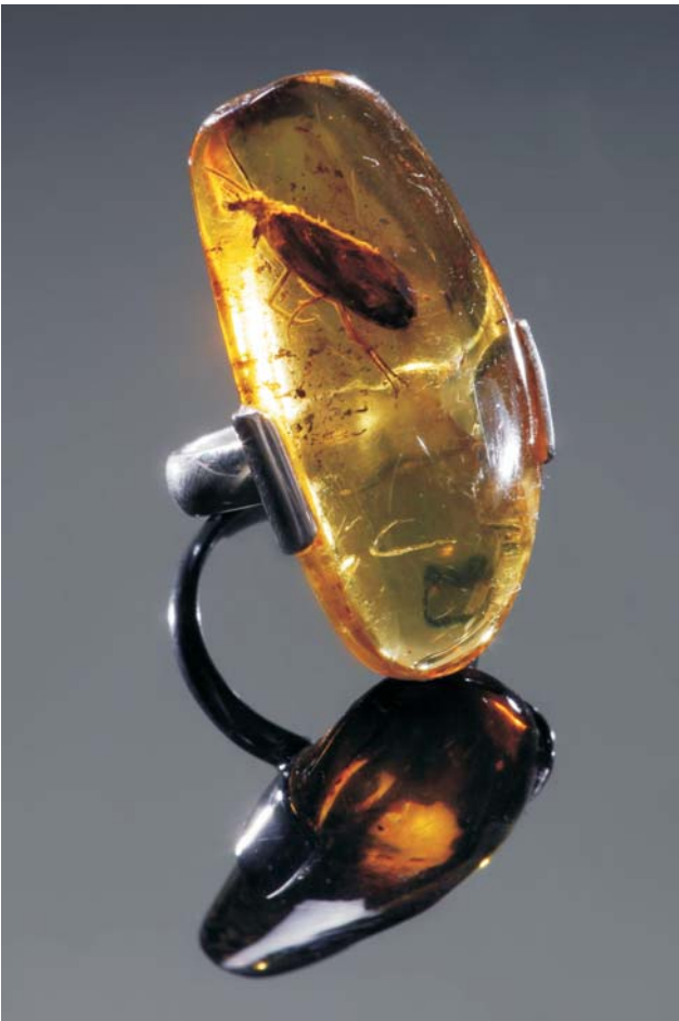
Ryc. 3. „Inkluzja”, pierścionek; bursztyn z chrzączką, srebro; 8,4 g; bursztyn przezroczysty żółty, wykonanie Andrzej Szadkowski; 2001.