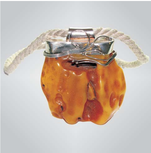
Ryc. 1. Wisior; bursztyn, srebro, sznurek; 196,8 g; bursztyn mieszany żółty, wykonanie Bogdan Sawicki. Ryc. 1, 2, 4 fot. M. Kazubski