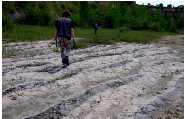
Ryc. 3. Megariplemarki – Kamieniołom Sadowa Góra