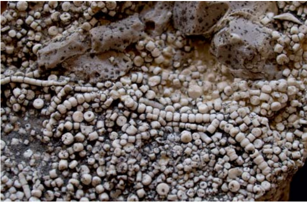
Ryc. 2. Szczątki liliowców z kamieniołomu Sadowa Góra. Ryc. 2–4 fot. R. Sikora