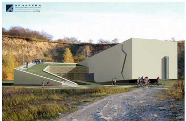
Ryc. 7. Budynek GEOsfery (etap II)