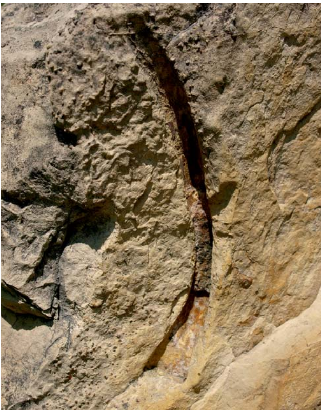
Ryc. 4. Odcisk żebra notozaura z fragmentem kości