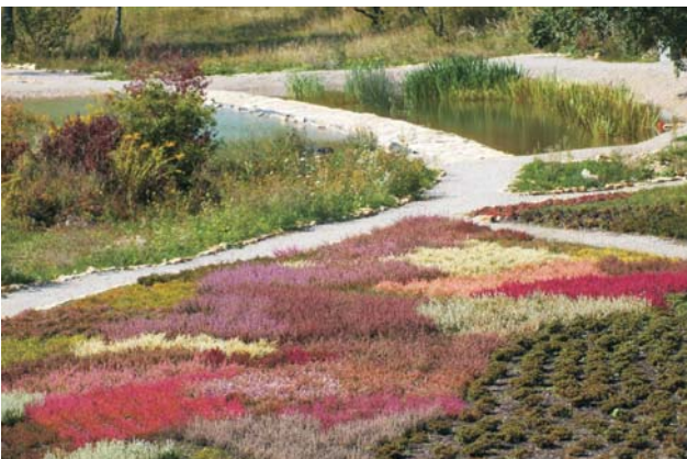
Ryc. 6. Wrzosowisko – fragment jednego z ogrodów sensorycznych założonych w kamieniołomie Sadowa Góra