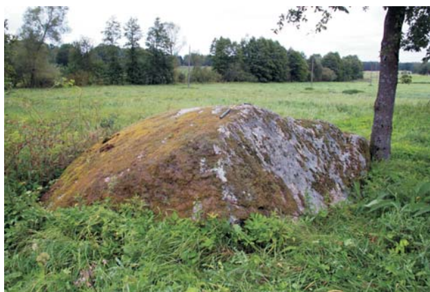
Ryc. 7. Granit Karlshamn w Nowym Koprzywnie. Największy głaz narzutowy o obwodzie 14 m na terenie geoparku