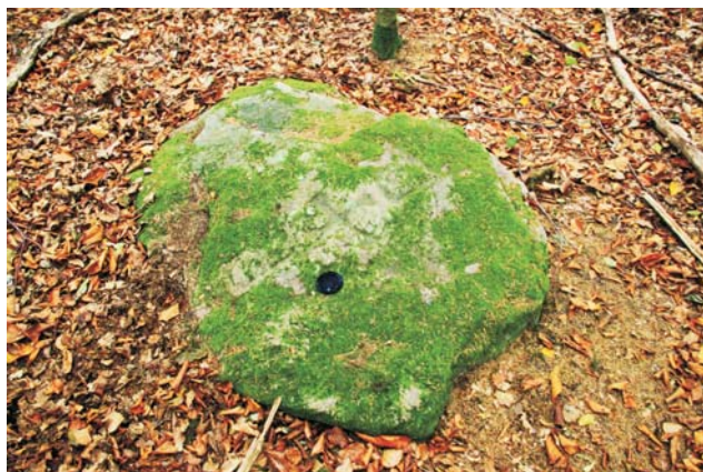
Ryc. 8. Eratyk przewodni – piaskowiec jotnicki, stanowiący głaz graniczny między Marchią Brandenburską a Koroną Polską