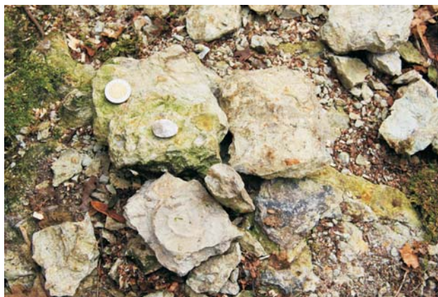
Ryc. 9. Porwak mezozoiczny odnaleziony w osadach czwartorzędowych żwirowni w Ogrodnie