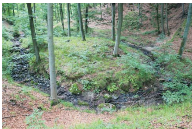
Ryc. 6. Głęboko wcięta w otaczającą wysoczyznę dolina erozyjno-denuwacyjna Wilcze Jary. Ryc. 5–9 fot. K. Kamińska