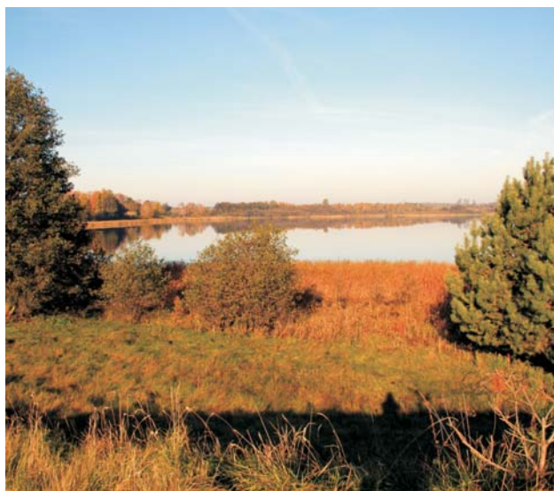
Ryc. 5. Rezerwat ornitologiczny, obejmujący wytopiskowe jezioro Prosino wraz z okalającymi je szuwarami. Utworzony w celu ochrony siedliska rzadkich ptaków wodno-błotnych