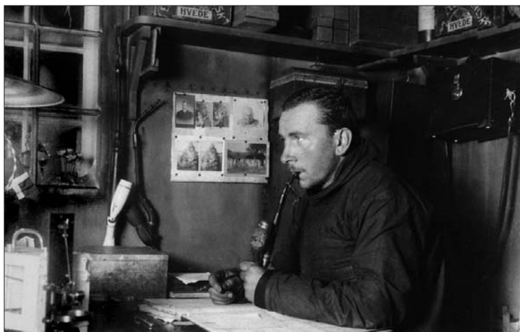
Ryc. 2. Alfred Wegener w czasie swej drugiej wyprawy na Grenlandię