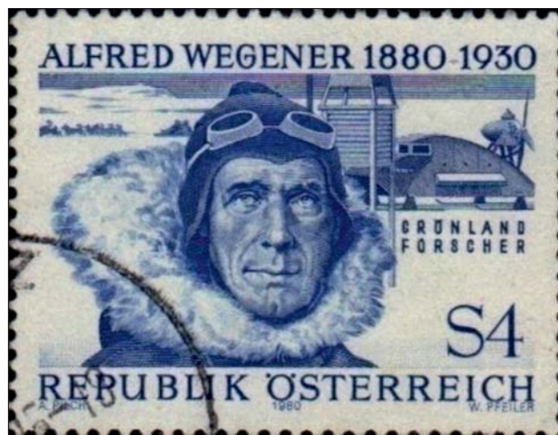
Ryc. 8. Znaczek pocztowy wydany w Austrii w 1980 r. ( www.paleophilatelie.eu )