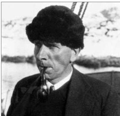
Ryc. 1. Alfred Wegener podczas wyprawy na Grenlandię w 1930 r.