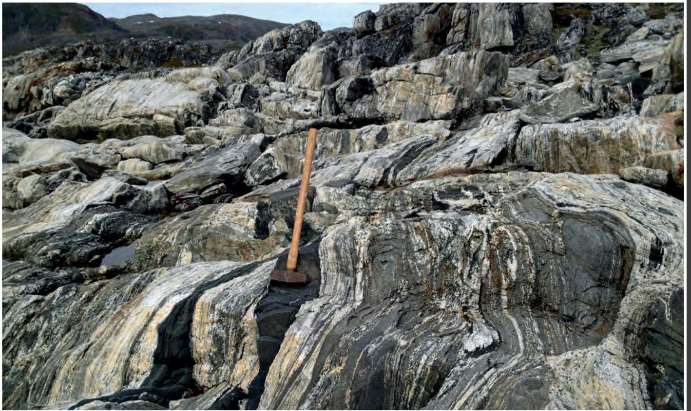
Ryc. 5. Odslonięcie gnejsów Uivak I z gnejsami Uivak II, Dog Island Fig. 5. Outcrop of the Uivak I gneisses, Dog Island