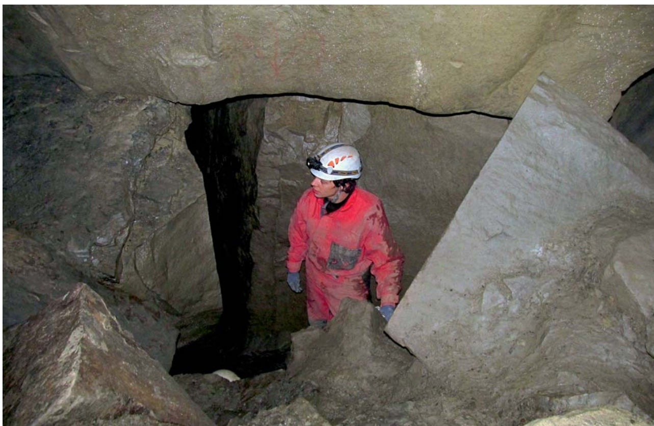
Ryc. 5. Blokowiskowy fragment jaskini Velkiej Ondrášovej.