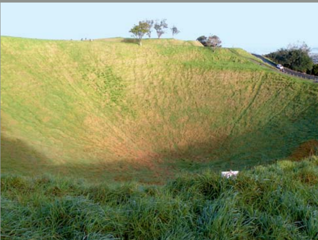
Ryc. 7. Krater stożka Mt. Eden. Ryc. 7 i 9 fot. A. Kozłowska