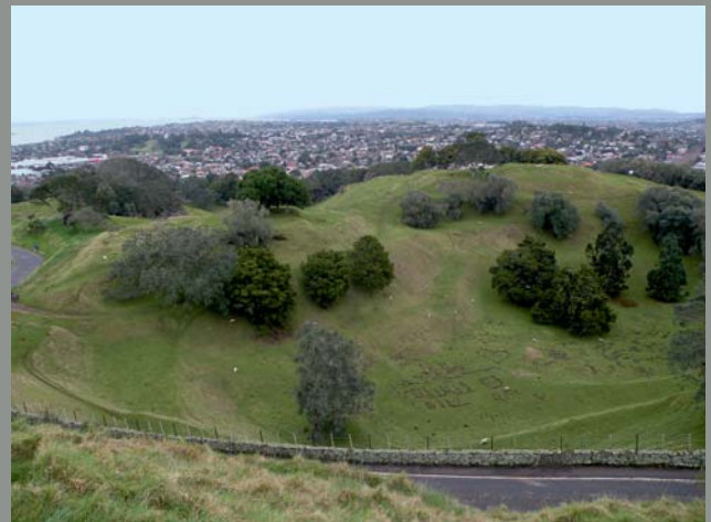
Ryc. 9. One Tree Hill – widok ze szczytu stożka na boczne ujścia i panorama Auckland