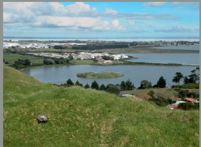
Ryc. 13. Widok z Mt. Mangere na Lagunę Mangere, płytki maar z pierścieniem tufowym. Ryc. 5, 6, 10 i 13 fot. K. Jarmołowicz-Szulc