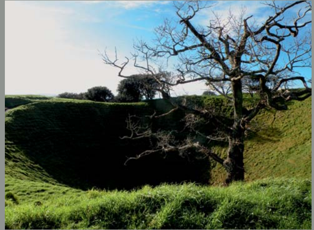
Ryc. 6. Dominujące na AVF centrum wulkaniczne Mt. Eden