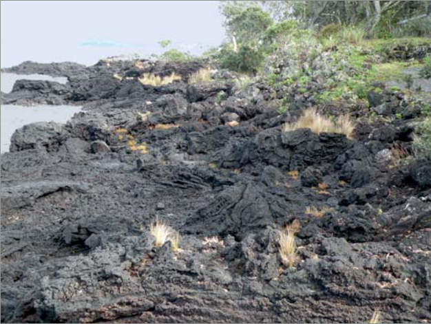
Ryc. 5. Zastygłe potoki lawowe na wyspie Rangitoto