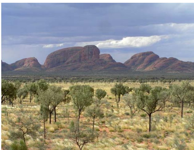
Ryc. 14. Kata Tjuta