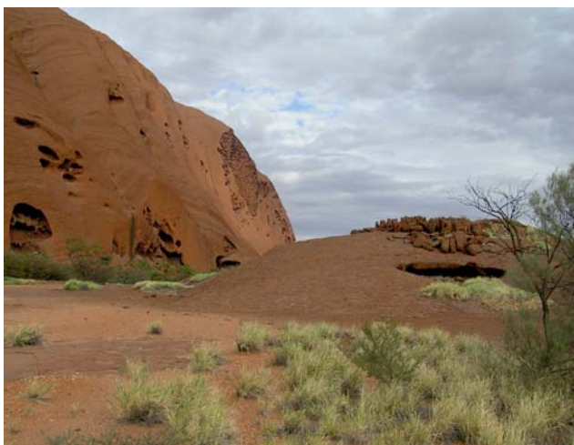
Ryc. 6. Formy wietrzenia piaskowców arkozowych budujących masyw Uluru i Małe Uluru