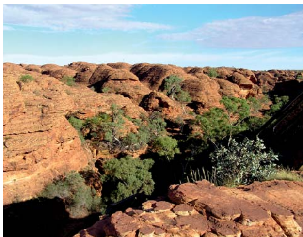
Ryc. 18. Kings Canyon i kopułowe formy piaskowców Meerenie na wierzcholinie. Ryc. 6, 9, 14, 17 i 18 fot. M. Nieć