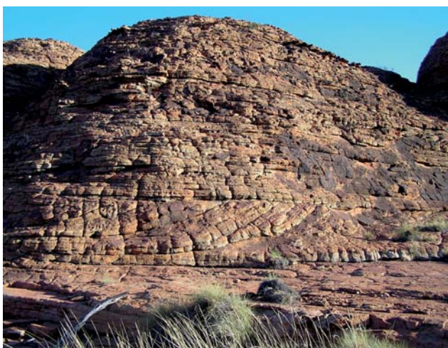
Ryc. 17. Kings Canyon. Piaskowce wydymowe Meerenie