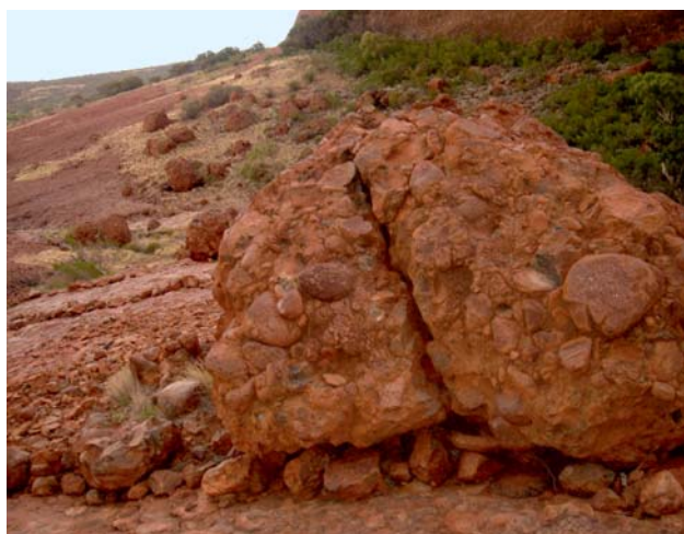
Ryc. 15. Kata Tjuta. Złepięce Mount Curie.