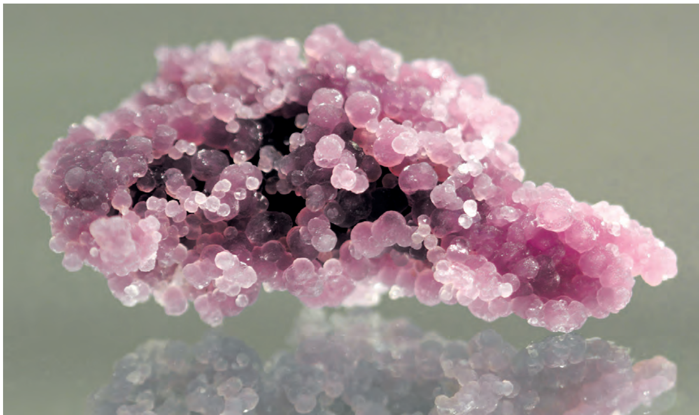
Ryc. 1. Skupienia groniaste chalcedonu. Indonezja