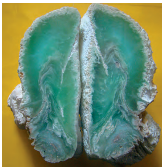
Ryc. 6. Chryzopraz, Wiry. Kol. J. Kawalki.