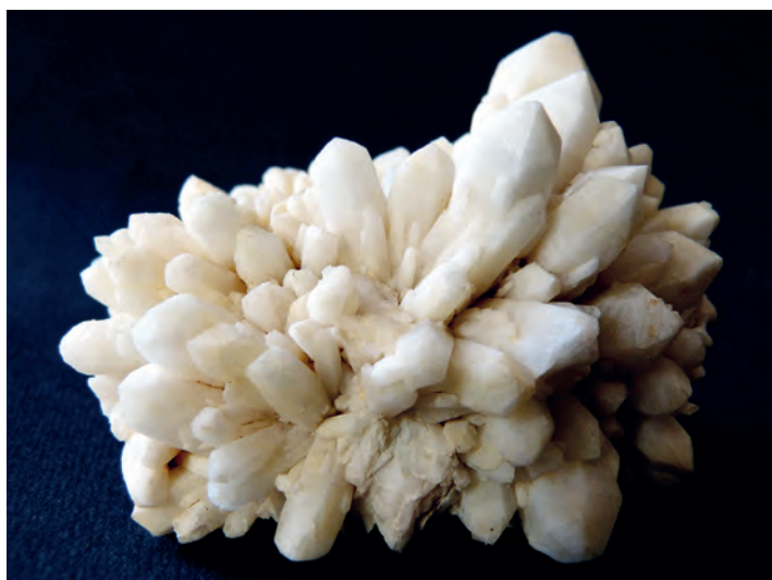
Ryc. 2. Kwarc mleczny, Taczalin. Kol. K. Kozakiewicz