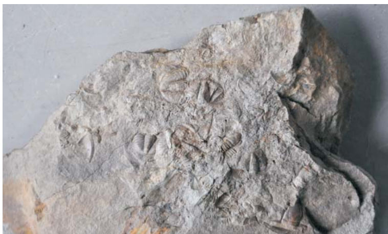
Trylobity dolnokarbońskie, Wałbrzych-Konradów. Kol. L. Dudzińskiego.

Wystawa czynna codziennie w godzinach 10.00–18.00