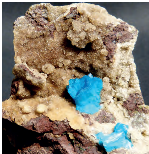
Ryc. 4. Cavansyt, Poona (Indie). Kol. J. Luklińskiego