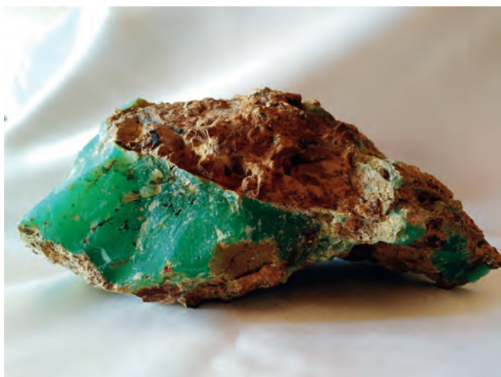
Ryc. 3. Chryzopraz, Szklary. Kol. R. Martowicza. Fot. R. Martowicz