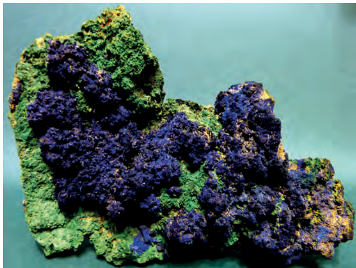
Ryc. 1. Azuryt, malachit, Tiger (USA). Kol. J. Luklińskiego. Ryc. 1, 2, 4, 5 fot. K. Kozakiewicz