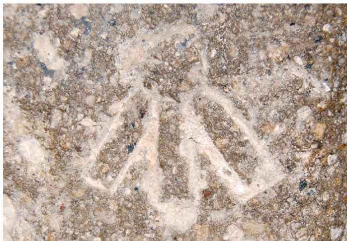
Ryc. 4. Katedra gnieźnieńska. Znaki kamieniarskie wykute w tzw. sztucznym kamieniu.