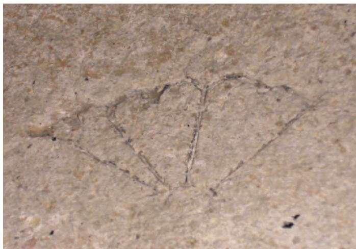
Ryc. 3. Katedra gnieźnieńska. Znak kamieniarski wykuty w tzw. sztucznym kamieniu.