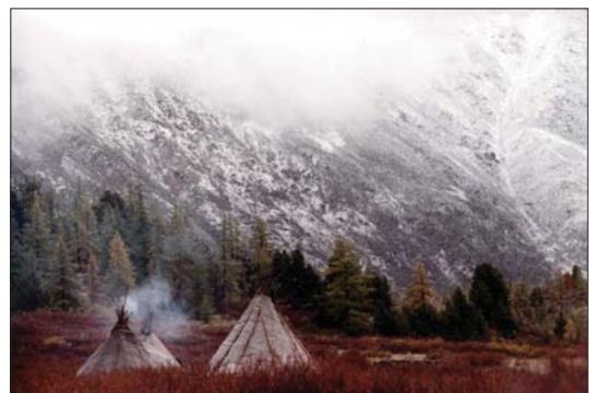
Czerwona tajga i czuumy Catanów