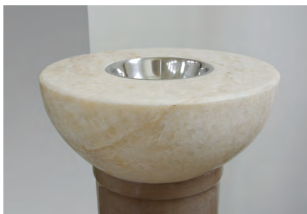
Ryc. 9. Kalcytowa chrzcielnica z wapienną podstawą.