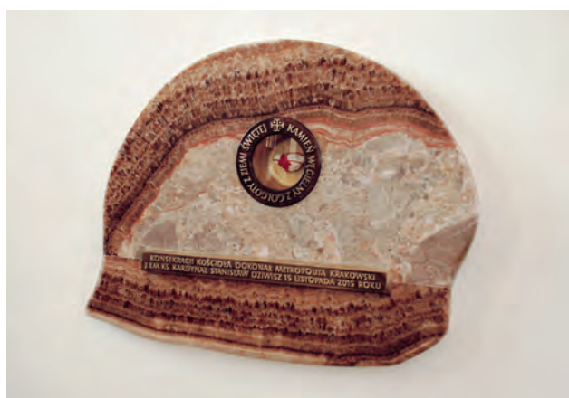
Ryc. 11. Kamień węgielny osadzony w brekcji wapiennej z kalcytem