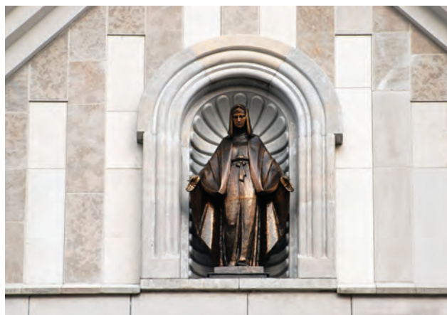
Ryc. 2. Fragment zewnętrznej elewacji kościoła pw. św. Jana Pawła II w Krzeszowicach