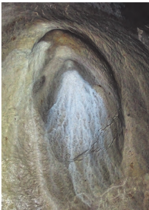
Ryc. 10. Naciek stalagmitowy na spągu Sali Kolumnowej pokrywany się świeżą laminą węglanową (sierpień 2022)