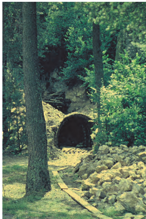
Ryc. 9. Budowa sztolni wejściowej do jaskini w 1967 r.