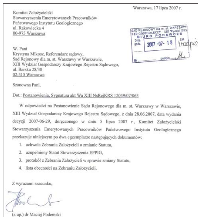
Ryc. 2. Kopia pisma Komitetu Założycielskiego Stowarzyszenia Emerytowanych Pracowników PIG do Sądu Rejonowego dla m. st. Warszawy, 2007 r.