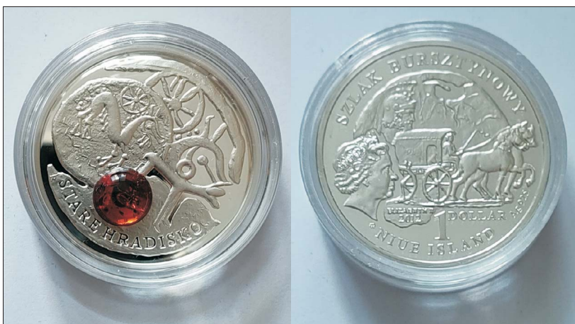
Ryc. 4. Moneta z bursztynem – seria NBP Szlak Bursztynowy

przykład z bursztynami (ryc. 4), które są najpopularniejszym materiałem używanym przez polskich emitentów takich monet. To zrozumiałe, tym bardziej że przecież Gdańsk jest uznawany za światową stolicę bursztynu. Chociaż ja bym wolał, żebyśmy za króla polskich kamieni uznali nasz rodzimy chryzopraz, unikalny, dolnośląski skarb. Jedną z tych mennic wydała także serię Skarby Polski (ryc. 5).