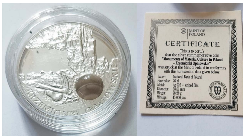
Ryc. 3. Srebrna moneta kameryzowana krzemieniem pasiastym wraz z jej certyfikatem – jest to 20 zł wybitych przez Narodowy Bank Polski w 2012 r. z okazji 90-lecia odkrycia kopalni w Krzemionkach Opatowskich