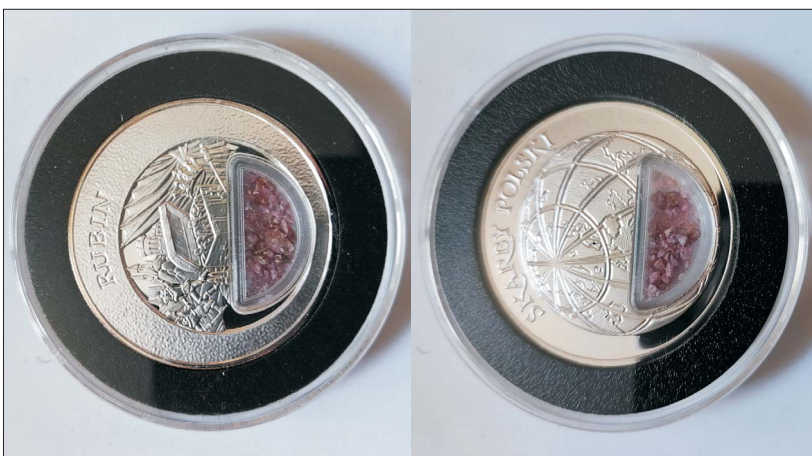
Ryc. 5. Moneta z rubinem – seria Skarby Polski