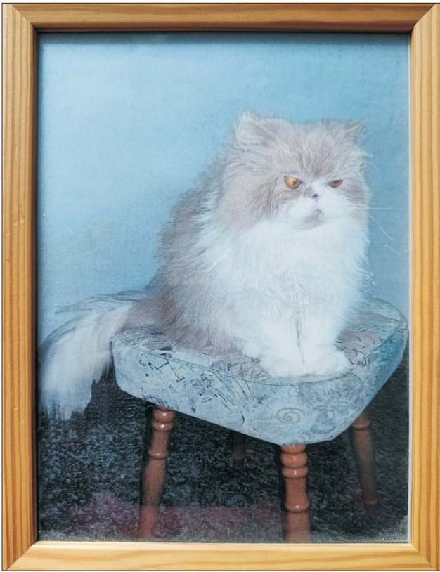
Ryc. 11. Kot Dyzio.

żona poważnie zachorowała, to siadał przy niej i chcąc jej ulżyć w cierpieniu, gładził ją łapką. Aż trudno w to uwierzyć. Po śmierci żony traktował mnie tak, jakbym to ja był jego lokatorem. Gdy zdarzało mi się później wrócić do