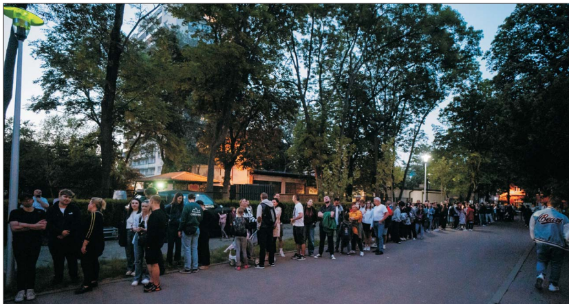
Ryc. 8. Kolejka chętnych oczekujących na wejście do Muzeum Geologicznego

Tegoroczne wydarzenie cieszyło się ogromną popularnością, czego dowodem była długa kolejka chętnych, która utworzyła się już chwilę po rozpoczęciu imprezy (ryc. 8). Dla osób oczekujących na zewnątrz także przygotowaliśmy specjalne atrakcje. Fasadę budynku przez cały wieczór rozświetlał spektakl mappingu łączący wątki artystyczne, kosmiczne oraz geologiczne (ryc. 9), który został przygotowany przez Daniela Fedorczyka z Fundacji Helisa . Zwiedzający zafascynowani kosmosem mieli okazję