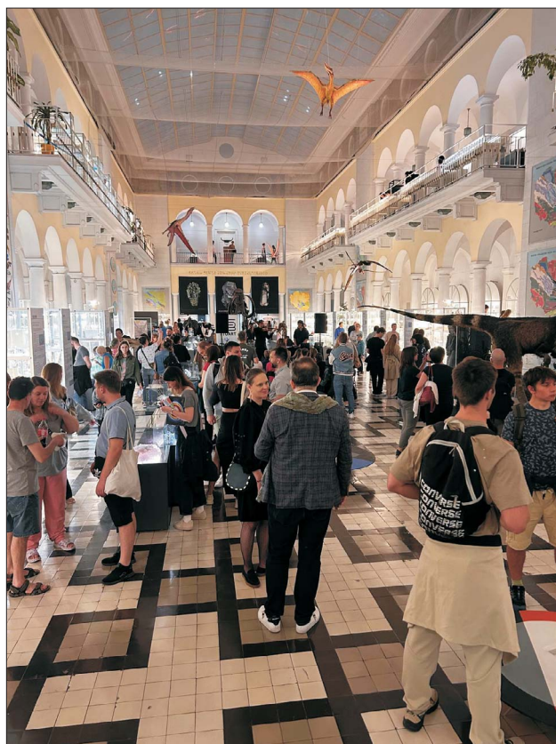
Ryc. 4. Wnętrze Muzeum Geologicznego podczas Nocy Muzeów.