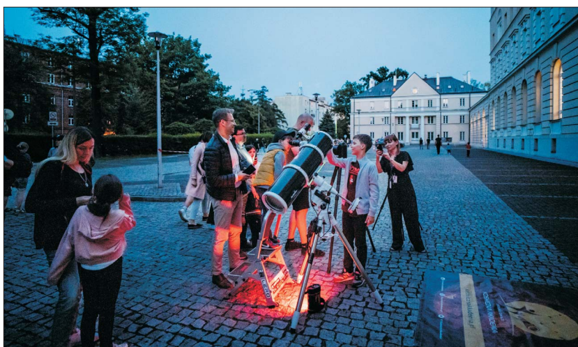
Ryc. 10. Obserwacja nieba przez teleskopy przed Muzeum Geologicznym przygotowana przez Kosmiczną Akademię

spojrzeć w rozgwieżdzone niebo przez teleskopy wspólnie z przedstawicielami Kosmicznej Akademii (ryc. 10).