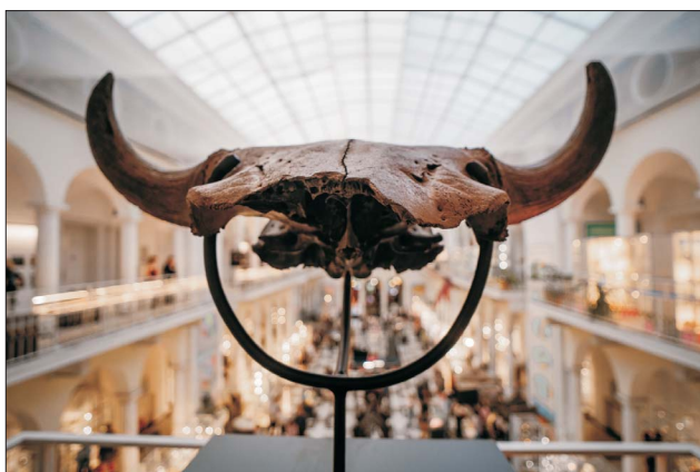
Ryc. 1. Czaszka prażubra na tle sali wystawowej Muzeum Geologicznego. Ryc. 1–3 i 5–10 fot. Kris Staszewski