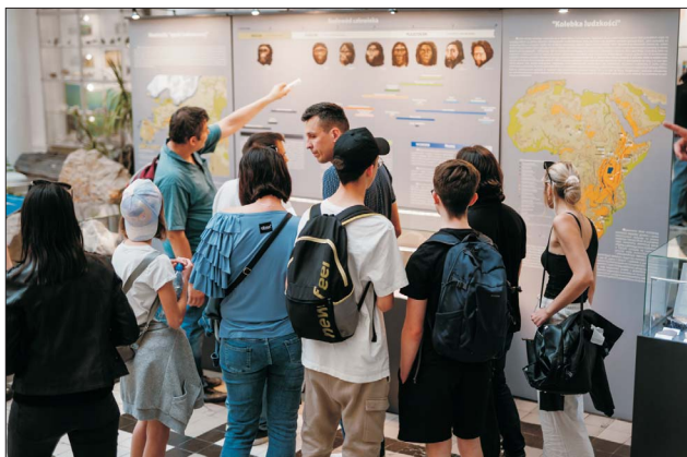
Ryc. 2. Zwiedzający ekspozycję Muzeum Geologicznego