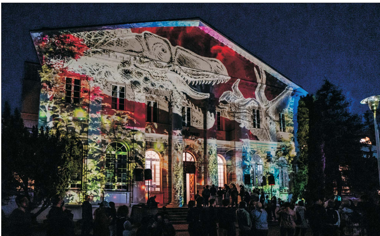
Ryc. 9. Spektakl artystyczny wyświetlany na fasadzie gmachu Muzeum