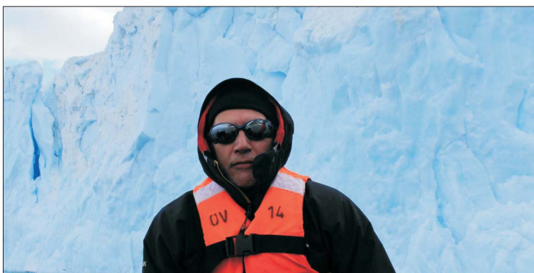
Ryc. 5. Za kołem polarnym, w drodze do bazy Carvajal na wyspie Adelaide