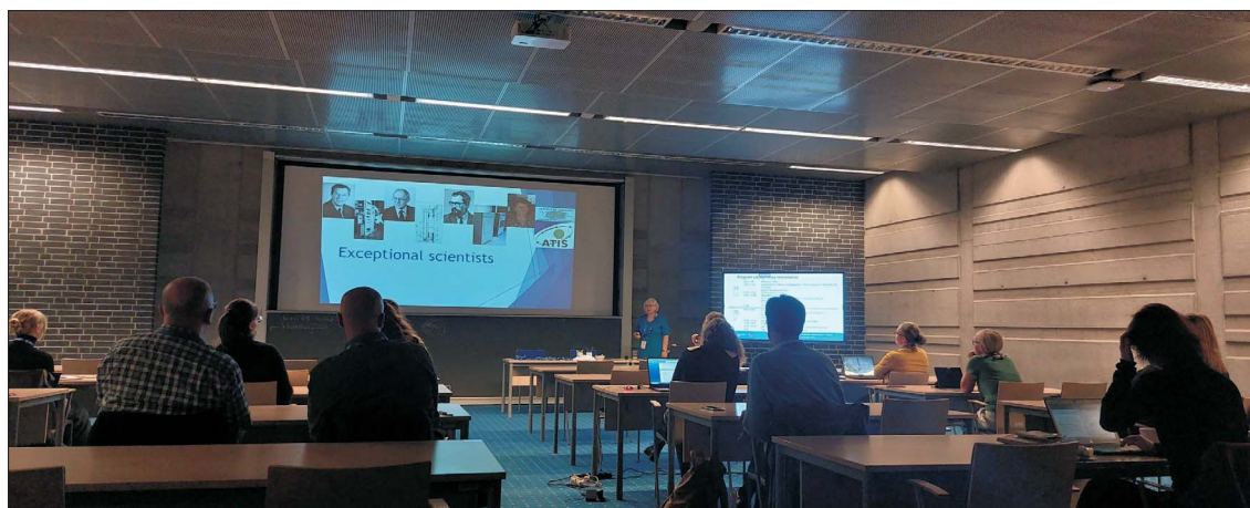
Ryc. 1. Otwarcie warsztatów – wykład wprowadzający prof. Danuty Michczyńskiej traktujący o datowaniu metodą ^{14}\text{C} .