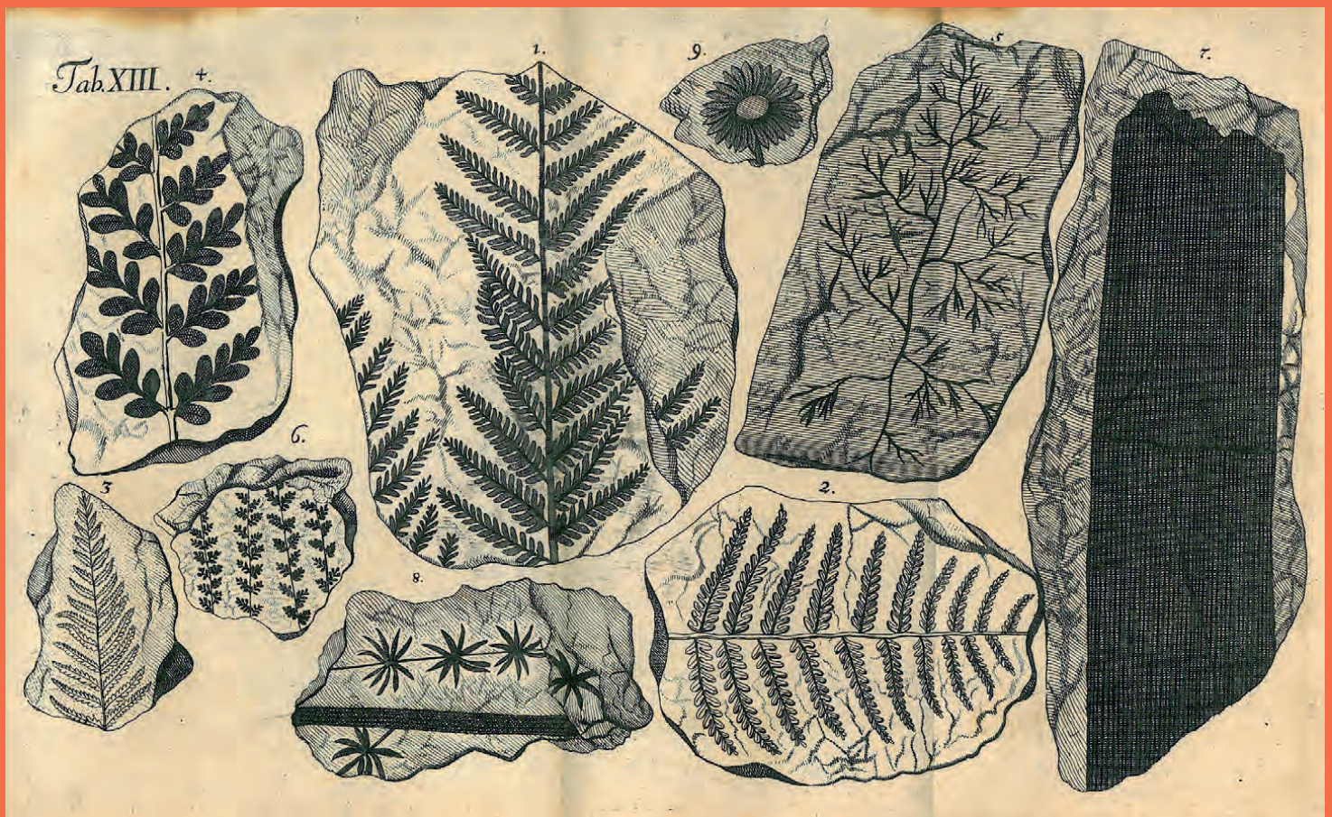
Wybrane tablice paleontologiczne z dzieła Silesia Subterranea (1720) Georga Antona Volkmana (1663–1721). Selected paleontological plates from Silesia Subterranea (1720) by Georg Anton Volkmann (1663–1721).