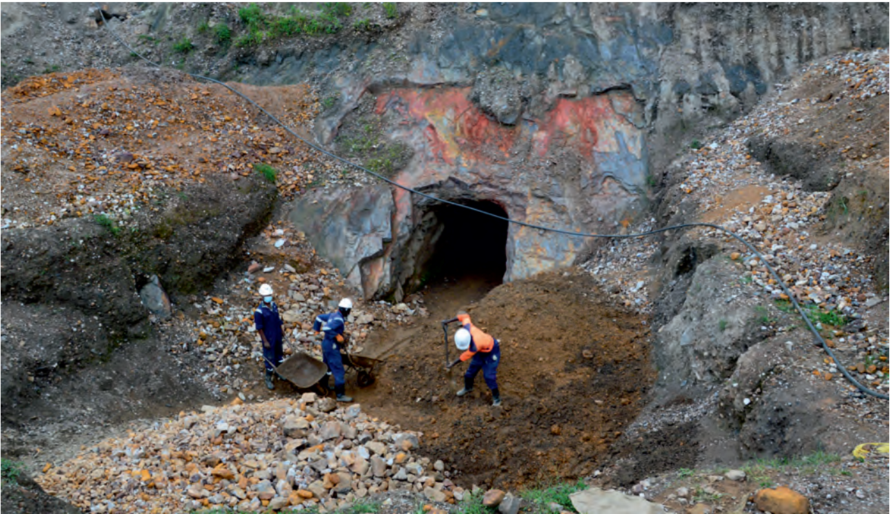
Ryc. 1. Jedna ze sztolni kopalni kasyterytu Isingiro-Kitagati na granicy z Tanzanią.

Areas of cooperation between the Polish Geological Institute and East African countries (see p. 1143)