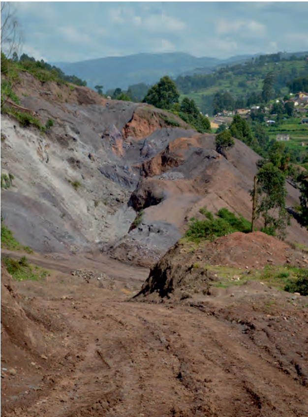
Ryc. 2. Złoże żelaza w Karukara. Przedmiotem eksploatacji są soczewy hematytu (miąższości kilku m i rozciągłości kilkudziesięciu m) w prekambryjskich skałach klastycznych.

Fig. 1. One of the adits at the Isingiro-Kitagati cassiterite deposit on the border with Tanzania.