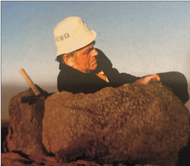
Ryc. 5. Odpoczynek w skalistym fotelu, Wadi Damrane, Sahara, 1986 r.

Mineralogicznej (IMA) jednogłośnie zaaprobowala ją w dniu 3.03.2023 r.