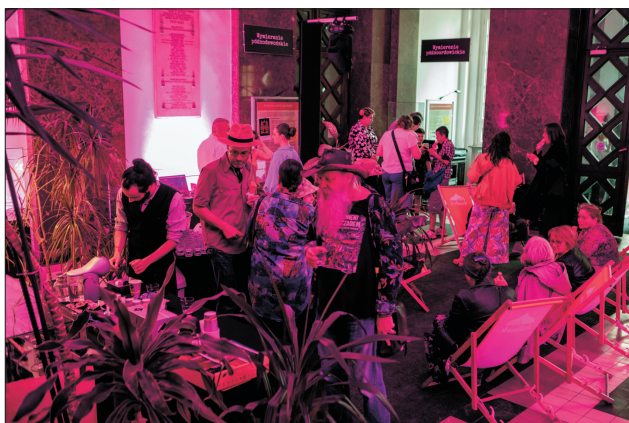
Ryc. 4. Uczestnicy gali finałowej w jurajskiej strefie relaksu.