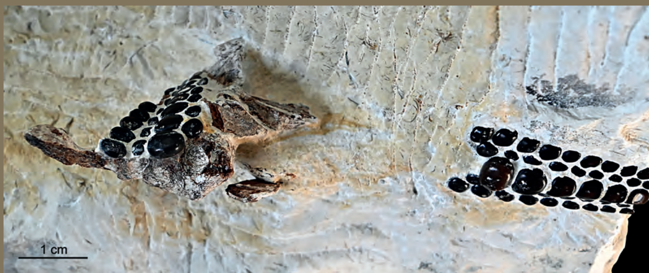
Ryc. 3. Aparat szczękowy pycnodontiforma (nowopłetwe). Późna jura (tyton), formacja kcyńska (kompleks III).