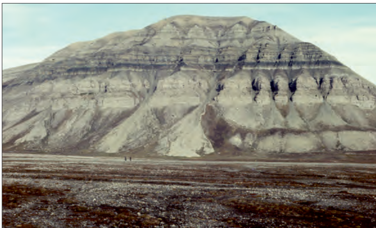
Ryc. 7. Spitsbergen, „jurajska” góra Janusfjellet przy „wejściu” do Sassenfjorden, 1979 r.