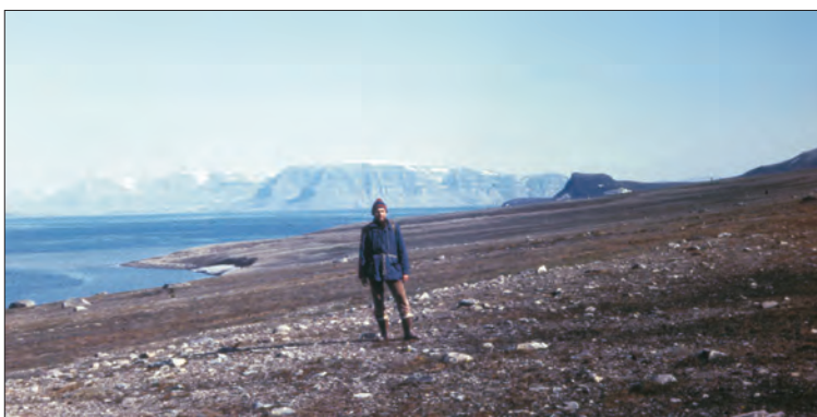
Ryc. 8. Spitsbergen, tundra nad Sassenfjorden, w głębi cypel Diabasodden, 1979 r.