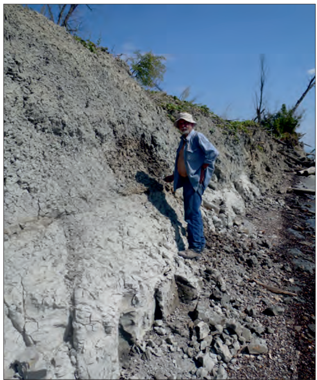
Ryc. 11. Rosja, Tatarstan, k. wioski Tarchany, nad brzegiem Zbiornika Kujbyszewskiego na Wołdze, w trakcie badań utworów górnourajskich, 2011 r.