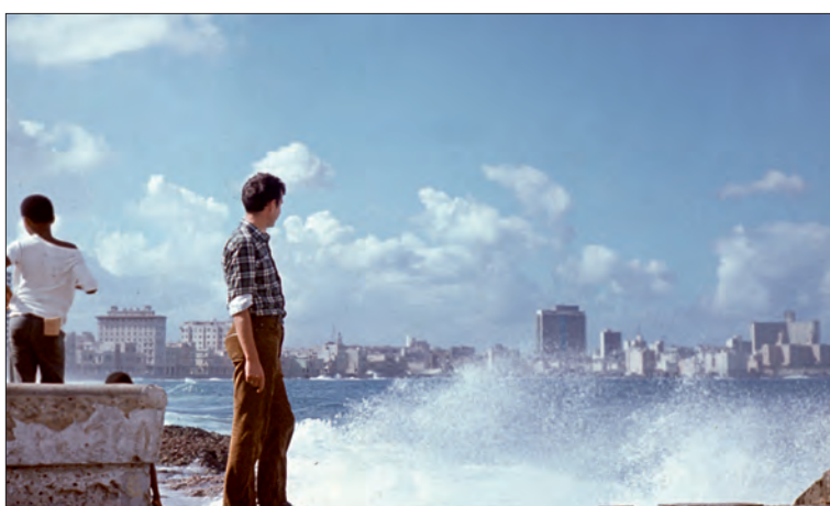
Ryc. 3. Hawana, na bulwarze nadmorskim Malecón, 1971 r.