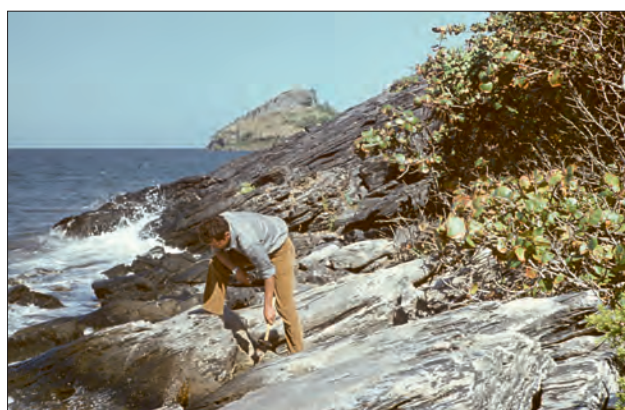
Ryc. 5. Na brzegu wyspy Isla de Pinos na Morzu Karaibskim. Odślonięte tu marmury powstały z przeobrażenia wapieni jurajskich, 1971 r.