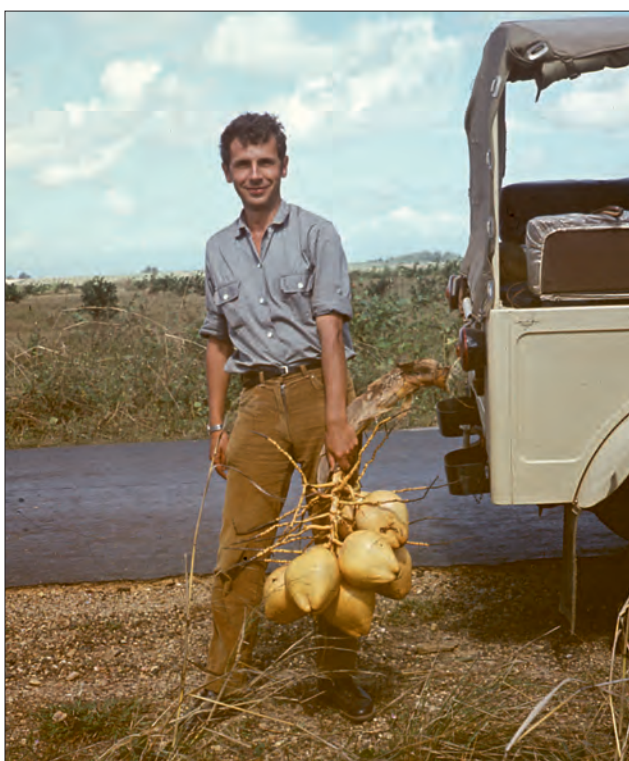
Ryc. 4. Gdzieś na Kubie, wszechobecna egzotyka po przyjeździe z PRL-u, 1971 r.