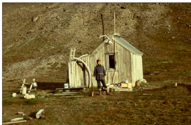
Ryc. 9. Spitsbergen, przed chatką traperską u podnóża Botneheia, 1979 r.