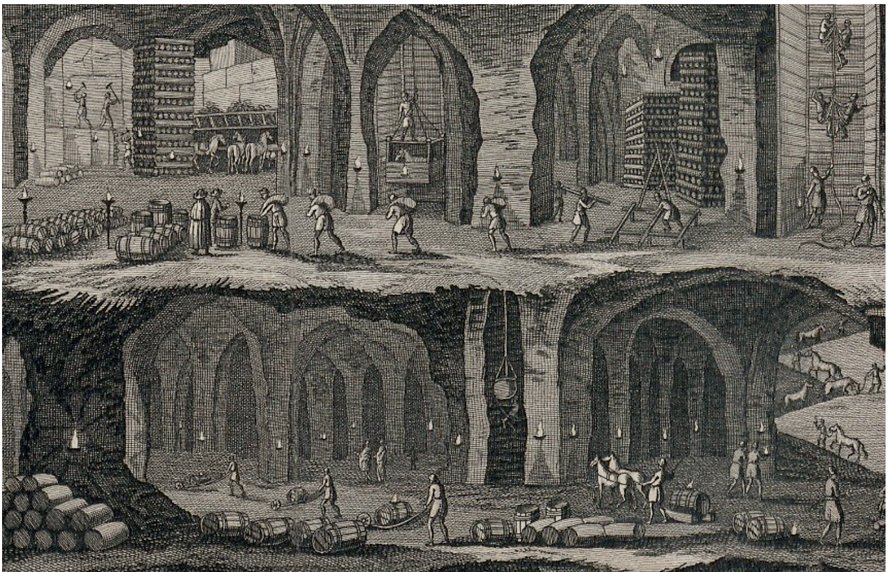
Ryc. 3. Wnętrze wielickiej kopalni, w poszczególnych sekcjach ryciny widoczne metody urabiania, transportu ludzi, urobku i koni, zabezpieczenia wyrobisk, oświetlenia (Grabowski, 1822)

Fig. 1. Tarnowskie Góry and its immediate surroundings in an engraving from 1812, with factory buildings with chimneys visible on the hills, and a mining field with numerous mining shafts in the background on the right (tarnowskie-gory.informator..., 2025)