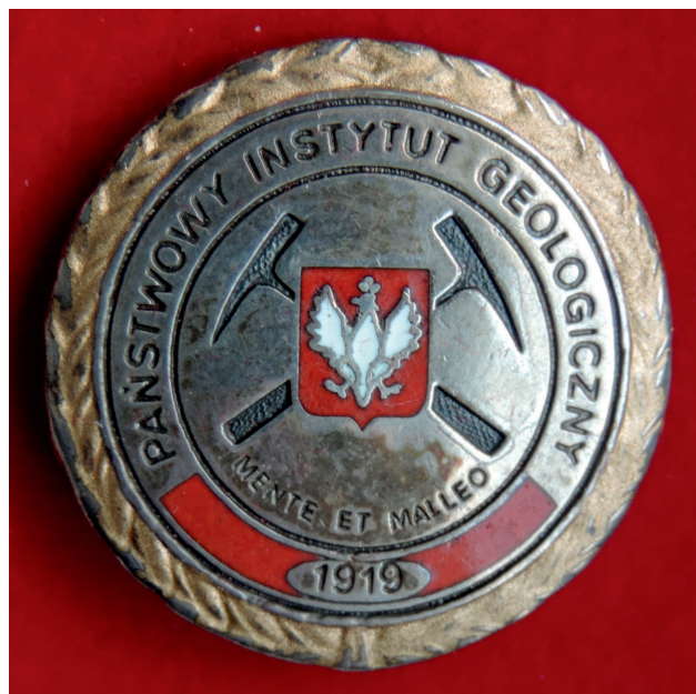
Ryc. 1. Złota Odznaka Państwowego Instytutu Geologicznego.

Autorem graficznego projektu honorowej Złotej Odznaki PIG był Zbigniew Werner. Przygotowanie matrycy odznaki i pierwszych jej egzemplarzy powierzono Artystycznej Pracowni Brązowniczo-Grawerskiej Miecznik z siedzibą w Warszawie. Odznaki były tłoczone w tombaku, emaliowane, polerowane, srebrzone, złocone, oksydowane i lakierowane (ryc. 1). Pierwszą ich serię (170 sztuk) wykonano w grudniu 1993 r. Po wyczerpaniu się zapasu w 2019 r. nowe egzemplarze Złotej Odznaki PIG zostały