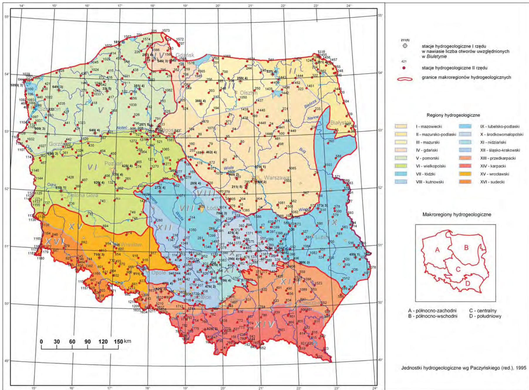
Ryc. 1. Lokalizacja stacji hydrogeologicznych sieci obserwacyjno-badawczej wód podziemnych IGP – PIB

Location of the PGI – NRI groundwater monitoring hydrogeological stations