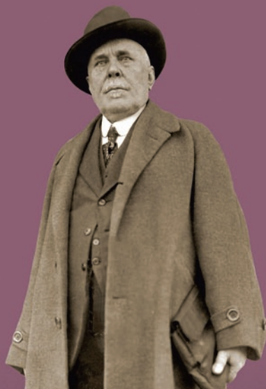
Profesor Józef Morozewicz

W dniu 15 lipca 1918 roku opublikowany został projekt statutu Polskiego Państwowego Instytutu Geologicznego. W przedstawionym przez Sekcję Górniczo-Hutniczą Ministerstwa Przemysłu i Handlu schemacie organizacyjnym, Państwowy Instytut Geologiczny podlegał nadzorowi Ministerstwa nie wchodząc w jego strukturę.