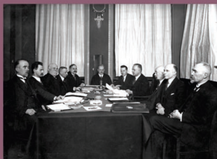
Instytut Popierania Nauki – obrady 1929 rok.