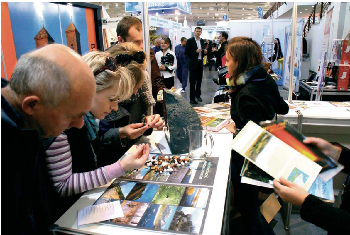
Ryc. 2. Pracownicy Muzeum Geologicznego PIG-PIB prowadzą konkursy wiedzy o środowisku.

Statuetką Acanthus Aureus nagrodzono stoiska najlepiej zaprojektowane i przygotowane do realizacji strategii marketingowej firmy podczas targów. Celem konkursu jest wyróżnienie najlepszych rozwiązań architektonicznych, graficznych, które sprzyjają bezpośredniej komunikacji z klientem i podkreślają pozytywny wizerunek firmy. Wśród nagrodzonych w konkursie Acanthus Aureus na Targach Regionów i Produktów Turystycznych Tour Salon 2010 znalazły się stoiska: Zachodniopomorska Regionalna