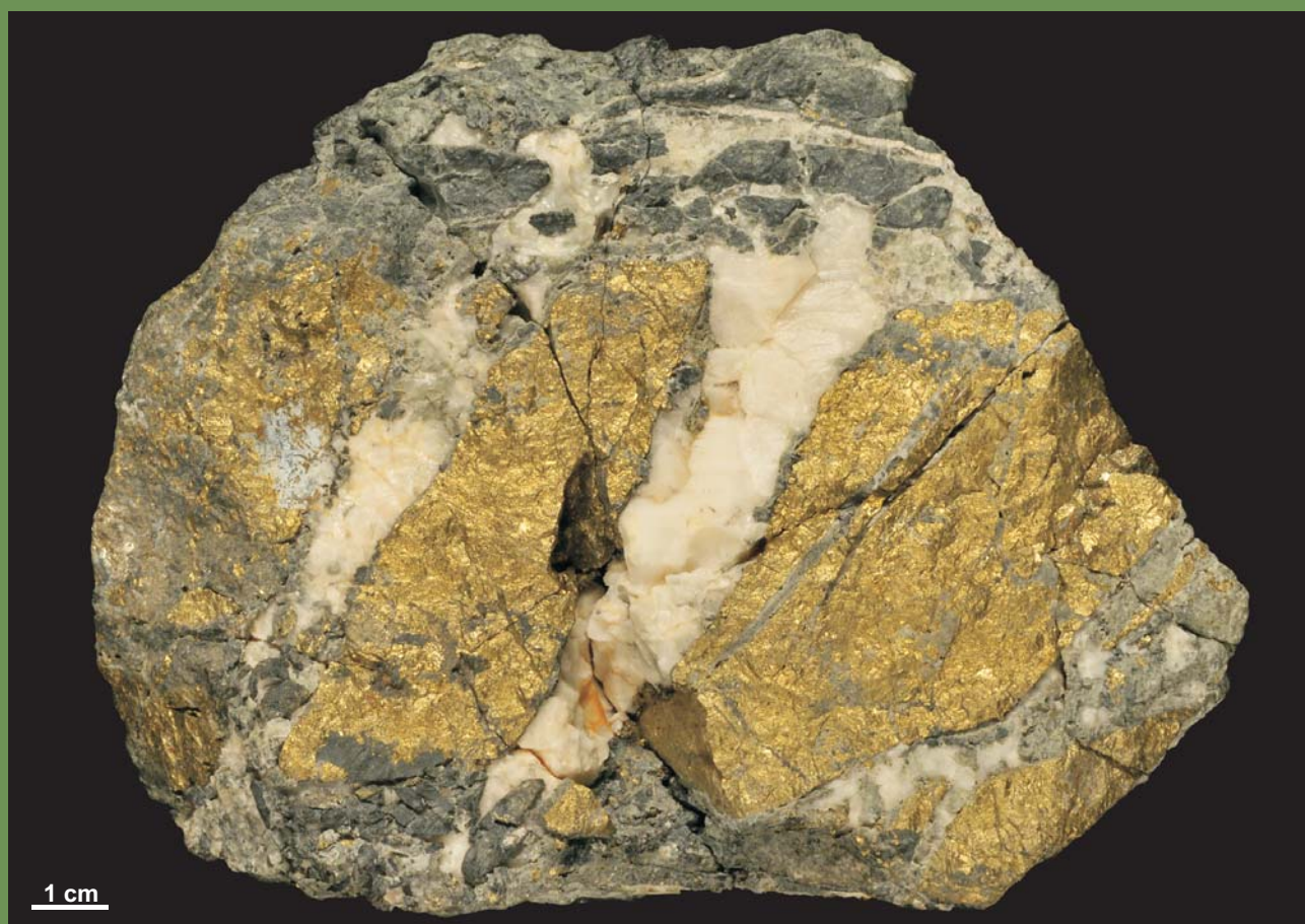
Ryc. 2. Chalkopiryt, kalcyt. Okaz pochodzi z kopalni Neu Adler w Ciechanowicach, coll. R. Siuda. Obie fot. B. Ruszkiewicz