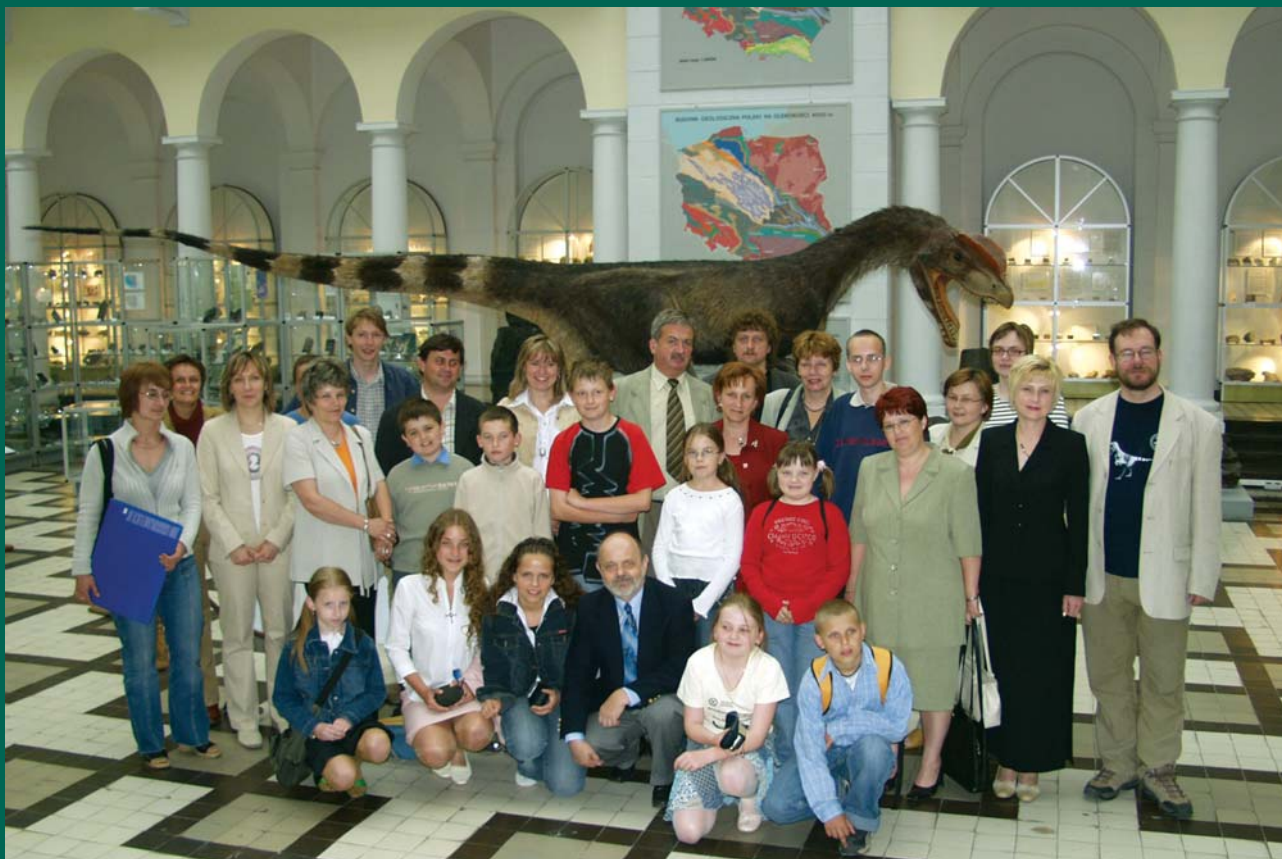
Ryc. 9. Finaliści wraz z opiekunami i organizatorami konkursu w Muzeum Geologicznym PIG w Warszawie.