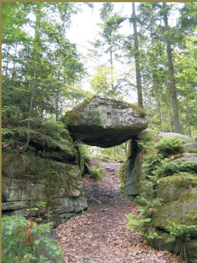
Ryc. 1. Brama Piekła utworzona z bloków piaskowca dolnotriasowego — pomnik przyrody w Rezerwacie Dalejów .