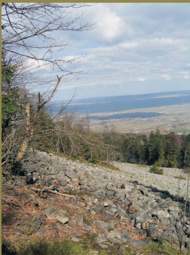
Ryc. 3. Gołoborze na północnym stoku Łyśca (Masyw Św. Krzyża); w tle Dolina Dębniańska i Pasma Sieradowickie. Rumowiska głazów kwarcytowych są związane genetycznie z tarasami krioplanacyjnymi i peryglacjalną soliflukcją jezorową typu osuwiskowego w okresie zlodowaceń środkowopolskich.