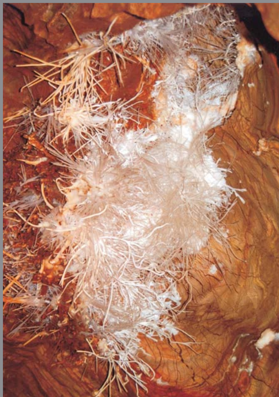
Ryc. 3. Różne formy rzadkich nacieków aragonitowych w Ochtyńskiej Aragonitowej Jaskini w Słowackim Krasie — Paweł Różański (wyróżnienie)