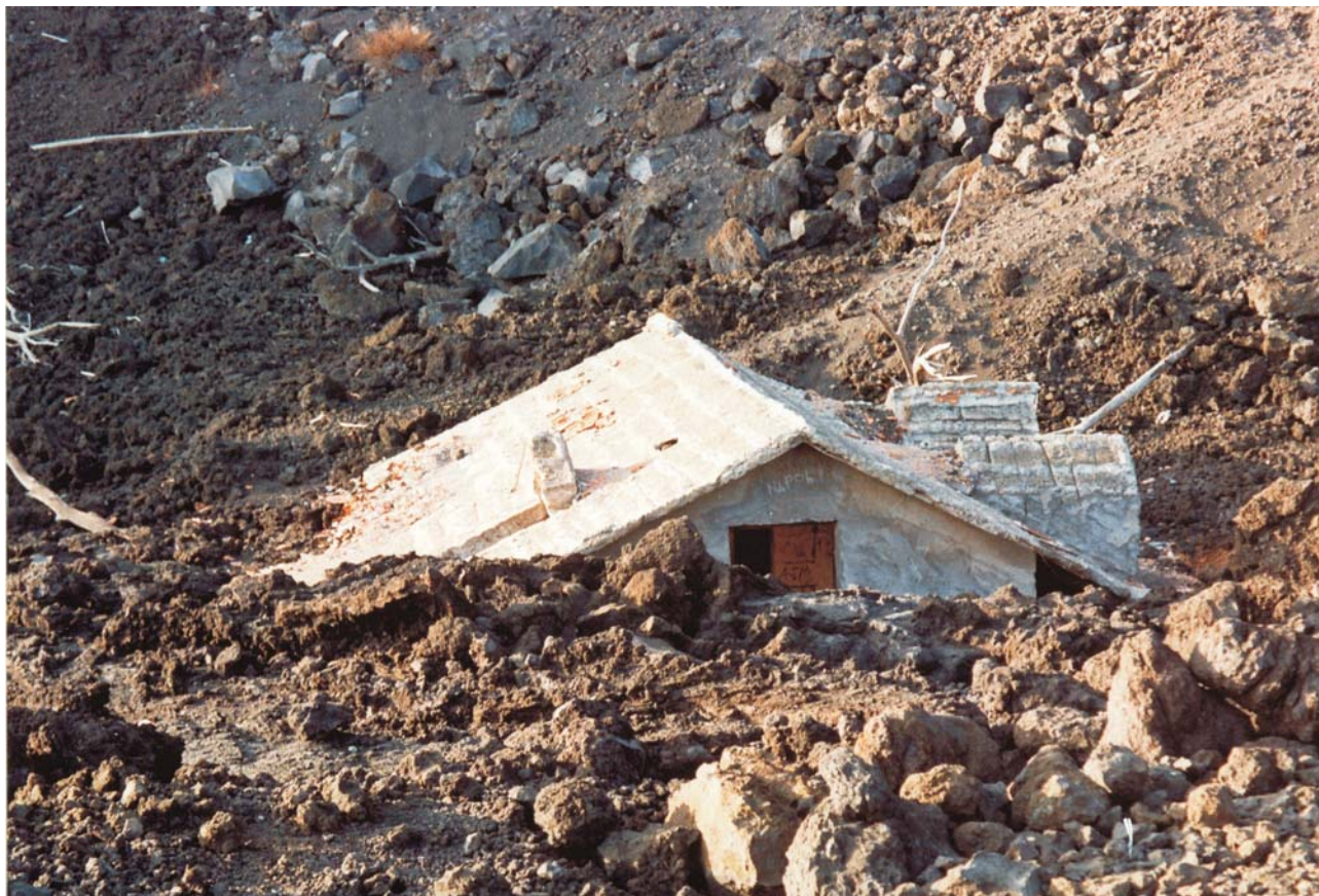
Ryc. 1. Okolice Etny po wybuchu w 1992 r. — Iwona Walentek (II miejsce)