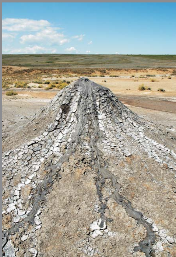
Ryc. 5. Stożek aktywnego wulkanu błotnego, Krym, Ukraina — Paweł Karamań (wyróżnienie)