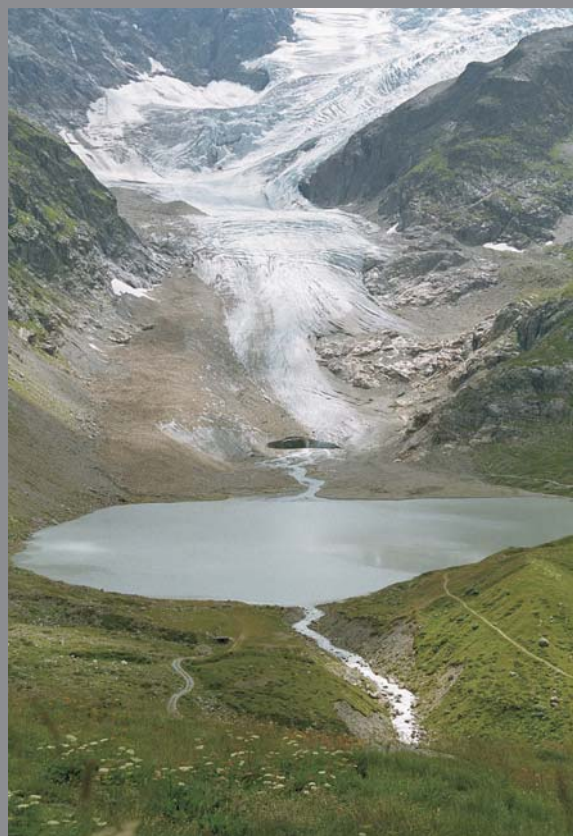
Ryc. 6. Lodowiec Stein w Alpach Berneńskich, Szwajcaria — Magda Derkacz (wyróżnienie)