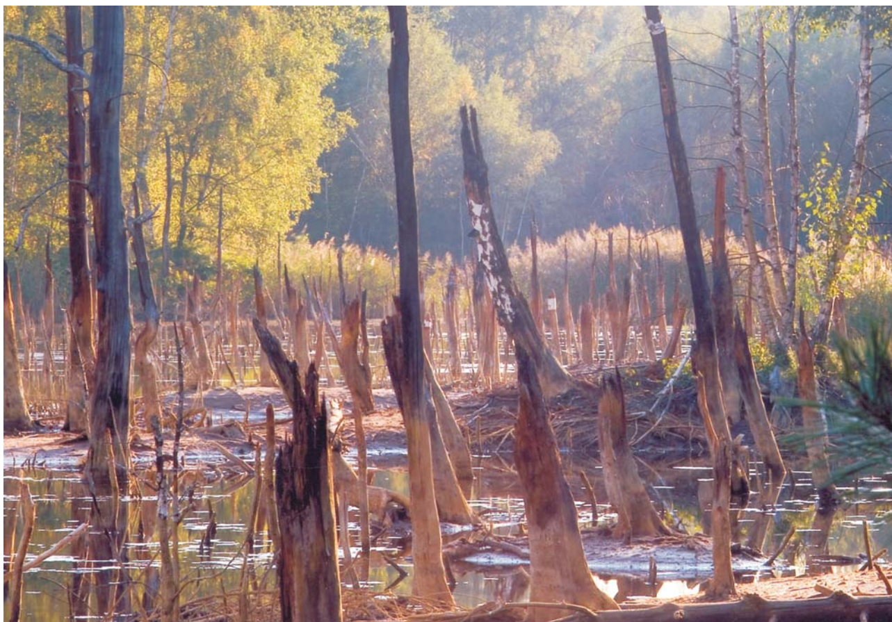
Ryc. 2. Jezioro antropogeniczne — Jacek Koźma (III miejsce)