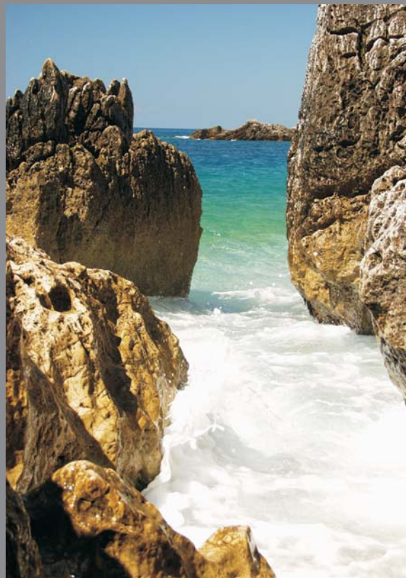
Ryc. 4. Skaliste wybrzeże Morza Jońskiego, zat. Jale, Albania — Monika Krzecińska (wyróżnienie)