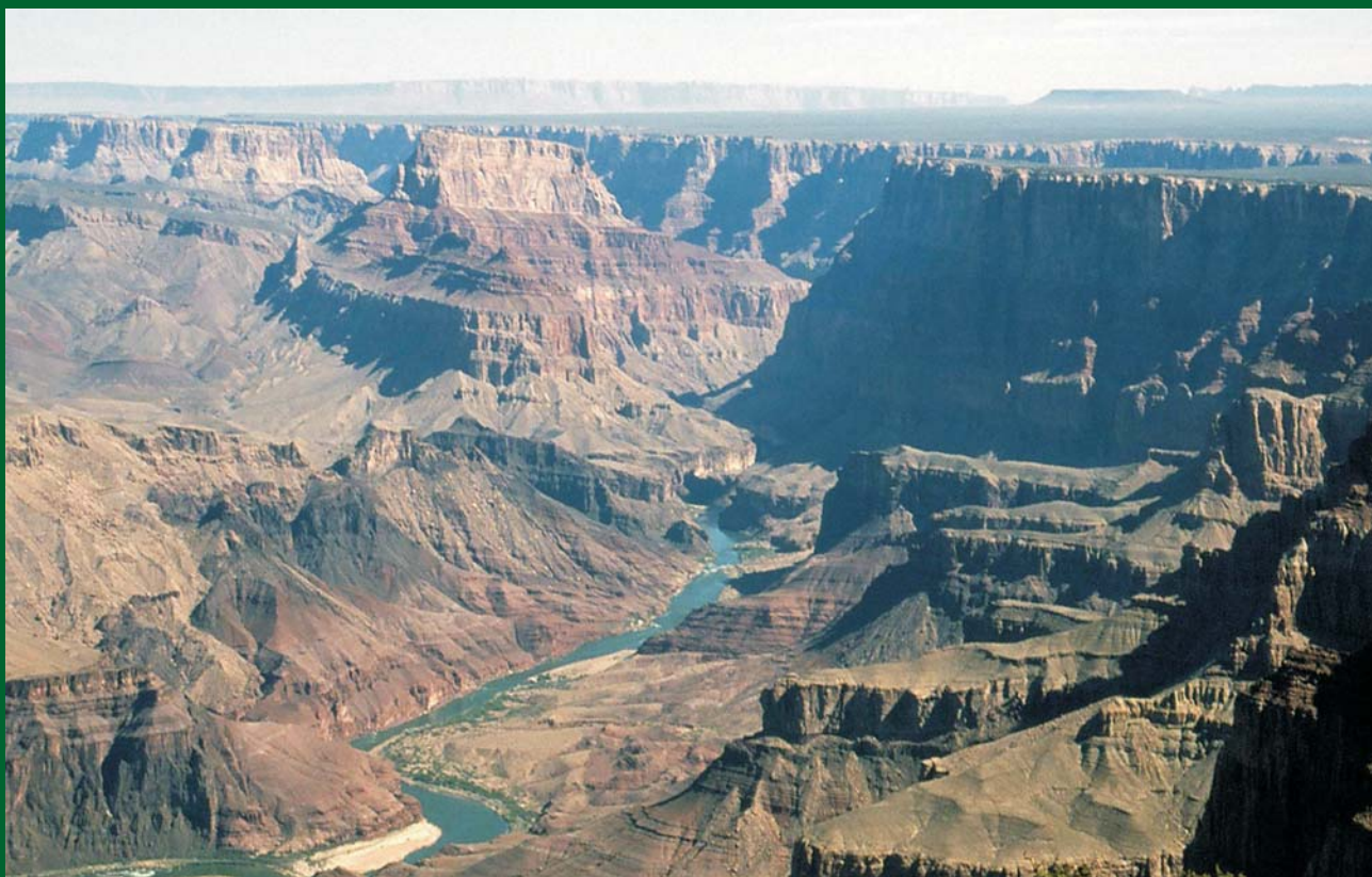
Ryc. 7. Wielki Kanion rzeki Kolorado, USA