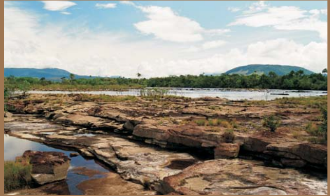
Ryc. 7. Płytko zalegające piaskowce i kwarcyty grupy Roraima na Isla Anatoly w pobliżu Salto El Sapo. Rejon Laguny de Canaima