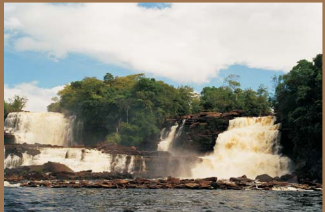
Ryc. 10. Wodospad Golondrina na rzece Carrao w rejonie Laguny de Canaima