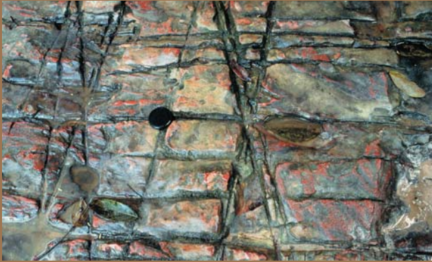
Ryc. 6. Regularna sieć spękań w jaspisach grupy Roraima w dnie kanionu poniżej Jaspisowego Wodospadu