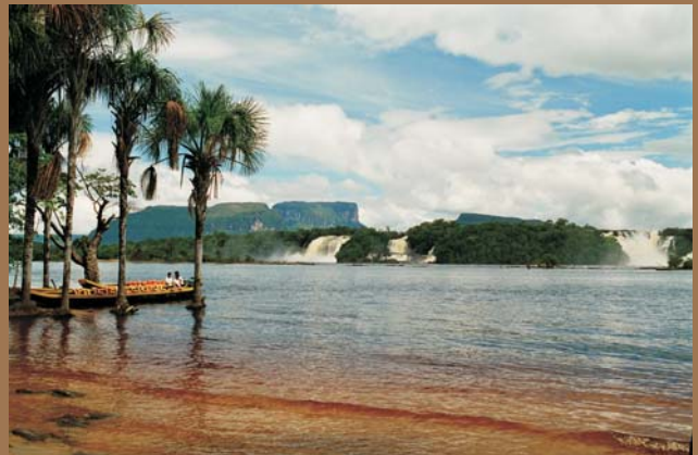
Ryc. 9. Laguna de Canaima na rzece Carrao. Na pierwszym planie przystań Laja; na drugim brzegu Salto Hacha i El Venado Tepuy