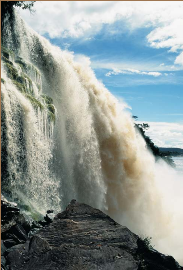
Ryc. 8. Wodospad El Sapo na rzece Carrao w okolicach Laguny de Canaima