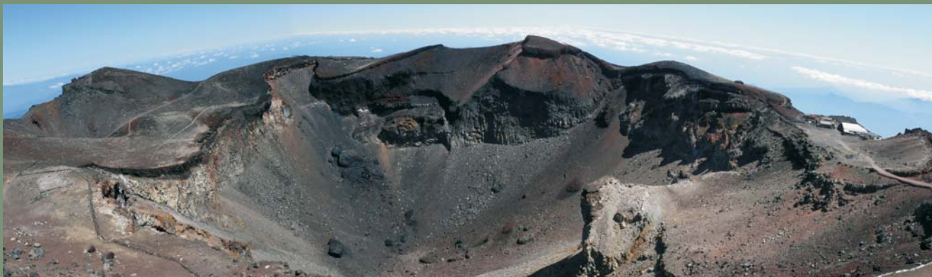
Ryc. 8. Panorama krateru Fudzi. Ryc. 8–10 fot. M. Słowakiewicz