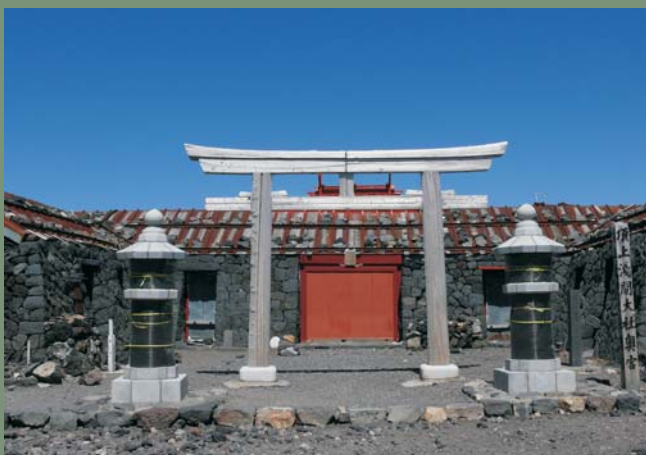
Ryc. 9. Brama torii przed wejściem do świątyni Sengentaisha-Okumiya na szczycie Fudzi