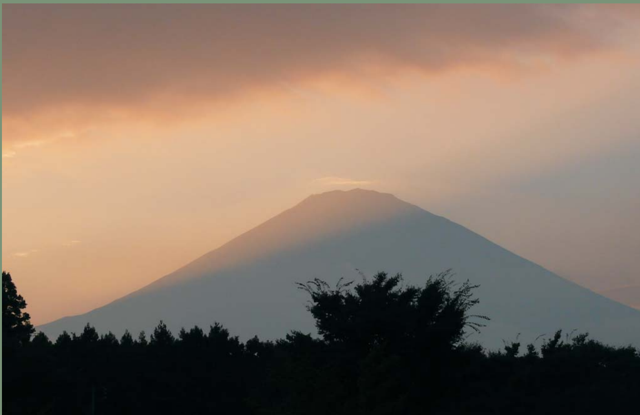
Ryc. 11. Fudzi o zachodzie słońca.