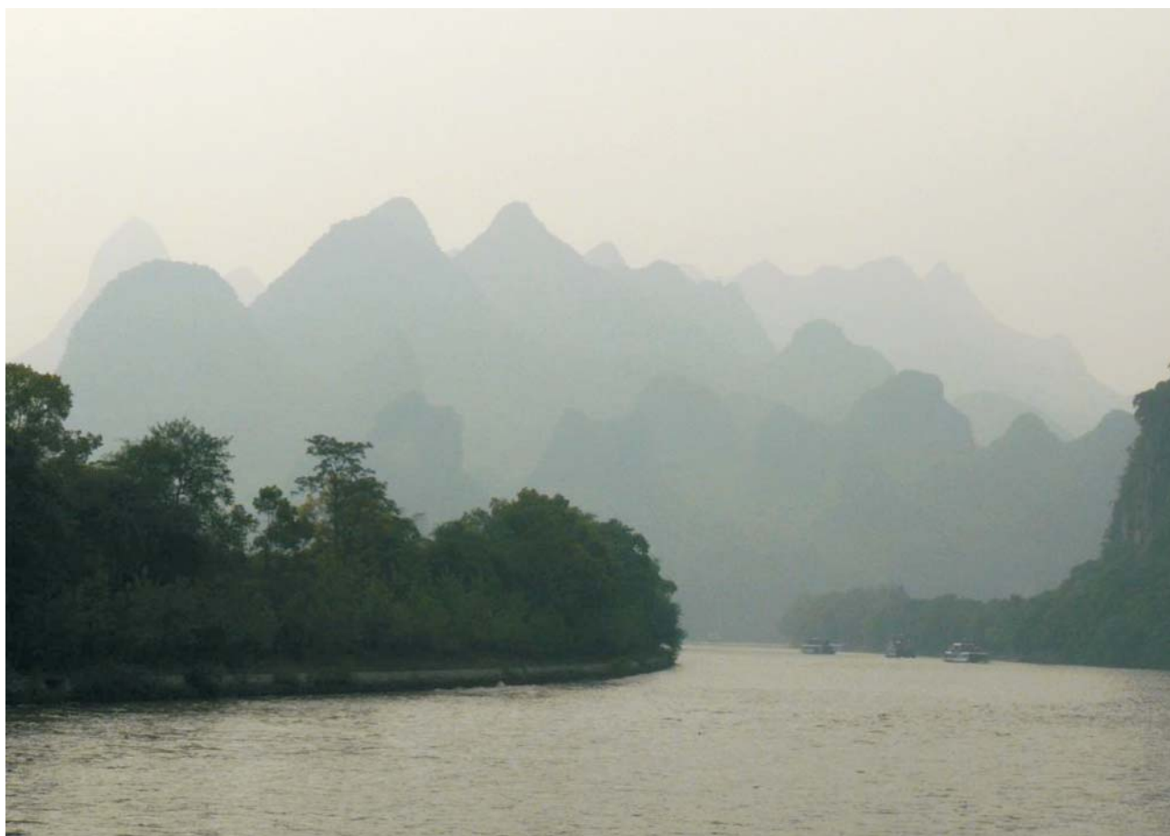
Ryc. 1 i 2. Zasnutą mgłą kraina mogotów nad rzeką Li.